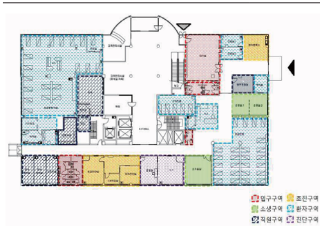
[Table 9] SC Center plan type

SC병원의 평면유형은 복도형+방사형으로 운영방법은 권역센터이기 때문에 독립형이다. 1층에 위치한 응급병상수는 32병상이며, SC병원 역시 외래진료부문을 따로 두어 응급의료기관 출입시 환자 분류에 신속하게 대응하고 있다.