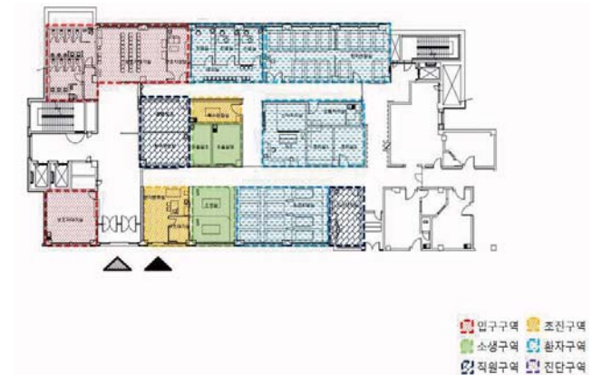
[Table 6] WK Center plan type