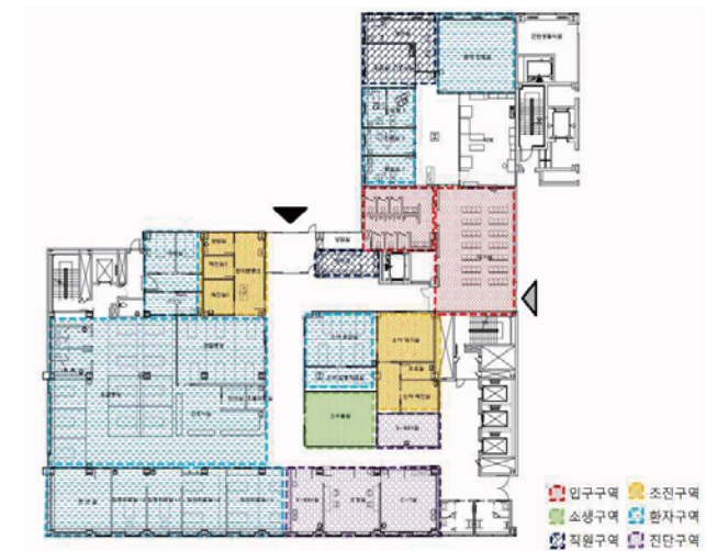
[Table 4] KG Center plan type