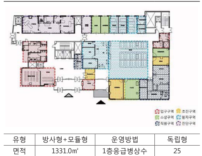
[Table 8] JN Center plan type

JN병원의 평면유형은 방사형+모듈형으로 운영방법은 독립형이다. 이 병원 역시 진료부문 중앙부에 간호스테이션이 위치하며 1층에 위치한 응급병상수는 25병상이다.