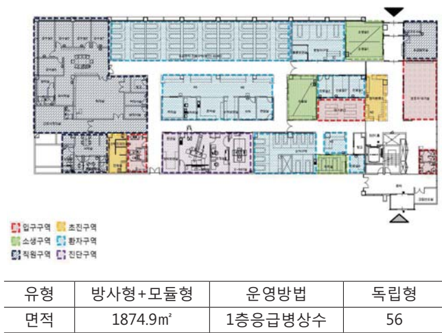
[Table 5] AJ Center plan type