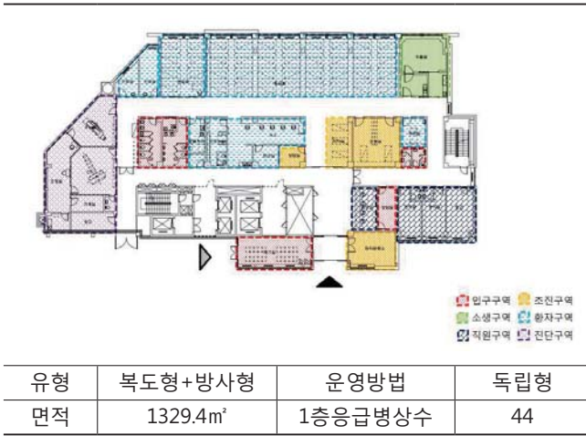
[Table 7] ES Center plan type

립형이다. 진료부문 중앙부에 간호스테이션이 위치하며 1층에 위치한 응급병상수는 44병상이다.