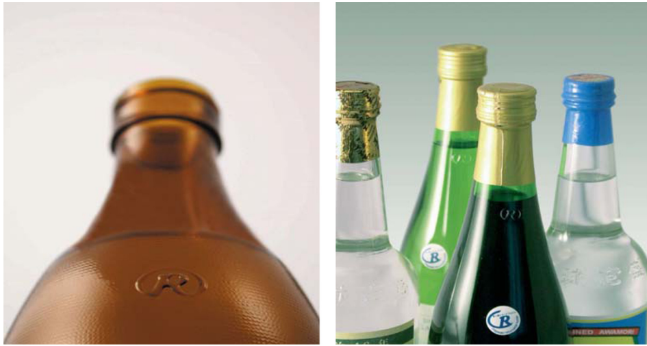
Fig. 3. “R” mark on glass bottle with light weight design in Japan.

있다. 국내에서도 이러한 경량화에 대한 필요성을 인식하고 경량화 기술 및 품질 관리 체계를 확보하는 노력을 진행해야 하는 시점이다.