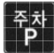
그림 4. 세그멘테이션 결과 Fig. 4. Segmentation Sample

그림 1은 주어진 도로 Sign 이미지의 전체영역에 대하여 1/4로 나눈 후에, 이 부분영역을 다시 1/4로 나누어지는 분할과정을 보여주고 있다. 그림 2는 분할되는