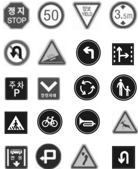
그림 6. 도로 Sign 데이터 Fig. 6. Samples of Road Signs Image

식 실험을 행 하였다. 그 결과를 표 2에 보인다. 표2에 보이는 바와 같이 데이터 베이스용 데이터와는 별도로, 각 Sign 에 대하여 50개씩 준비하여 인식실험을 행한 결과, 우수한 결과를 보였다.