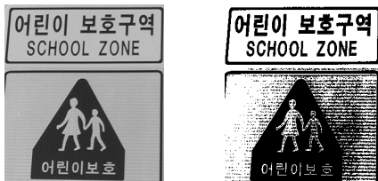
그림 5. 전처리 전후의 이미지 Fig. 5. Preprocessed Image for Origin data

본 연구에서는 도로 Sign을 인식하기 위하여 실제로 도로상에 있는 Sign을 디지털 카메라로 찍어서 모두 같은 크기로 정규화한 후, 이 데이터를 이미지 인식을 위한 입력으로 하였다. 전체적 흐름은 이미지 데이터를 받아, 전처리로 크기 정규화와 에지처리, 명암처리를 처리하고, 세그멘테이션을 행한다. 그 후, 미리 주어진 참조 패턴과 매칭을 행한 다음에 출력을 하는 일반적인 형식을 취한다. 다음 그림 5는 한가지 예로써, 전처리가 마쳐진 이미지를 보이고 있다.