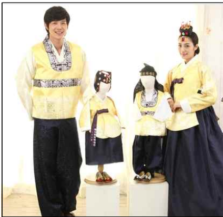
<그림 1> 첫돌 가족 한복

이상 전통 돌 복형은 아이의 첫 번째 생일을 귀하게 여기는 전통문화의 한 맥락에서 전통복식 또한 그대로 유지해서 받아들이고자 하는 소비자들을 위해 판매되는 것으로 이해되었다. 그러나 20세기 품목이 많았던 남아의 돌 복은 성인 남자의 간소화 경향과 함께 포 종류가 생략되고 조끼, 마고자를 대신하는 배자가 입혀지는 등 간소화 경향이 확인되었는데 이는 다소 복잡한 전통문화를 편리함을 쫓아가는 현실에 맞추기 위함이라고 분석된다. 이와 함께 새로운 풍속으로는 <그림 1> 17) 과 같이 돌날 가족이 함께 입는 가족한복도 판매되고 있었다.