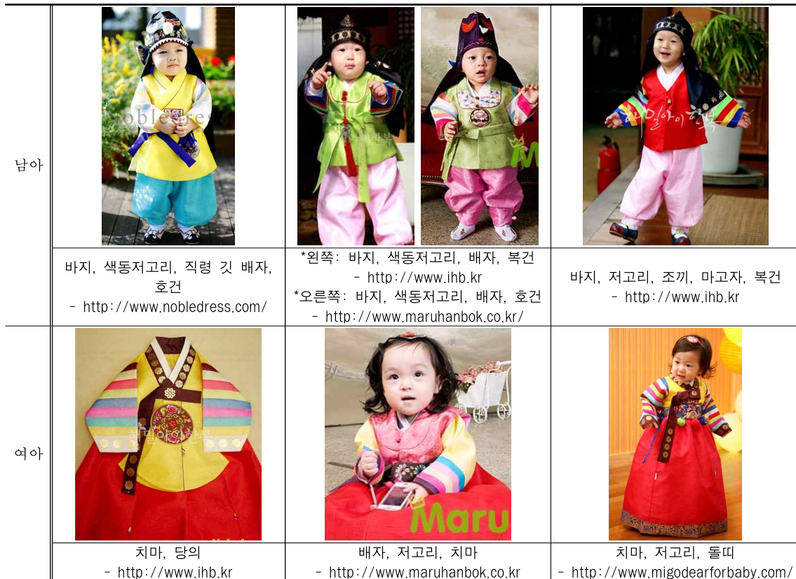
<표 5> 전통 돌 복형-품목의 간소화와 재구성

남아의 돌 한복의 품목을 보면 바지, 색동저고리, 배자에 호건이나 복건을 판매하고 있었다. 배자는 조선후기 남녀가 착용한 품목 16) 으로 20세기 돌 한복에서는 확인되지 않는 품목이었다. 이는 2000년대 남자의 한복일습에 조끼와 마고자를 대신하여 착용되면서 남아 돌 복에도 활용되기 시작한 것으로 보인다. <표 5>에서처럼 직령의 배자형태와 맞깃의 배자가 입혀졌고 명도가 높은 선명한 색깔로 배합하여 판매되고 있었다. 이외에도 전통 돌 복에서 포(袍) 종류를 제외한 바지, 저고리, 조끼, 마고자, 복건이나 호건을 판매하기도 하였다. 이처럼 전통 돌 복 형에서 남아의 돌