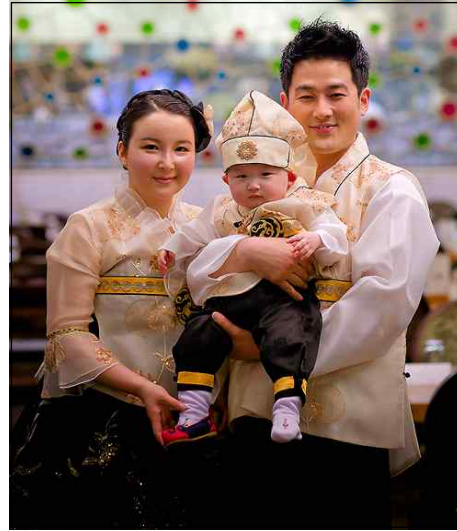
〈그림 4〉 남아 돌잔치 한복 예

이상 퓨전한복은 전통 돌 한복에서 장식의 변형, 구성의 변형, 드라마에서 재현된 새로운 품목을 추가하여 제작 판매되고 있었고, 이는 전통문화를 지키되 현대 생활에 맞는 편리함과 전통미를 추구하기 위한 노력인 것으로 이해되었다. 이와 함께 최근 인터넷을 통해 확인되는 돌잔치의 복식을 보면 〈그림 3〉 20) , 〈그림 4〉 21) 와 같이 전통 한복이나 퓨전 한복으로 첫 돌을 맞이한 아이와 부모가 함께 동일한 색과, 디자인으로 착용한 모습을 볼 수 있어 〈그림 1〉의 가족 돌 복 판매 및 대여가 실제 이루어지고 있음을 알 수 있다. 이는 2012년 현재의 돌잔치, 돌 복과 관련된 새로운 풍속도임을 확인할 수 있었다.