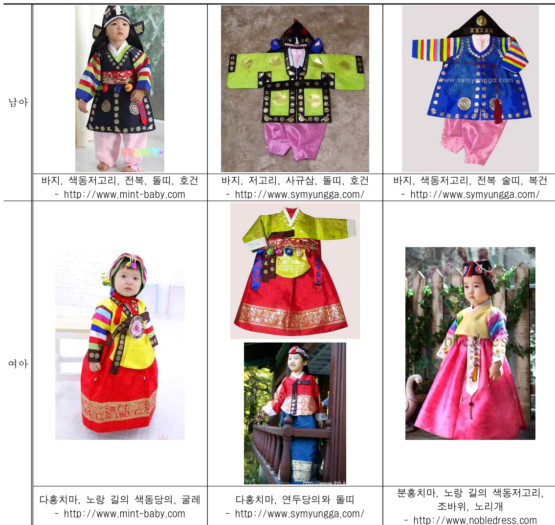
<표 4> 전통 돌 복형-전통 돌 복의 답습 형

인터넷 쇼핑몰에 판매되고 있는 남녀 전통 돌 복의 답습 형은 <표 4>와 같다. 전통 돌 복의 품목을