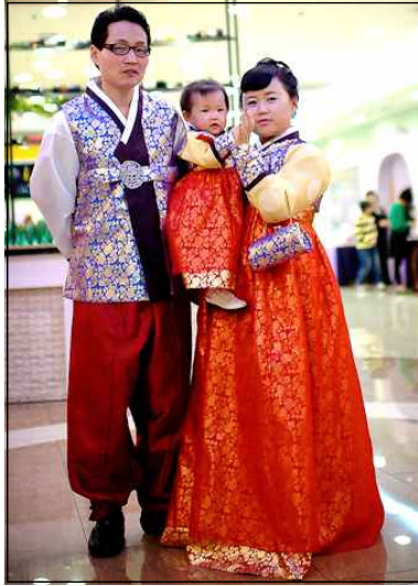
〈그림 3〉 여아 돌잔치 한복 예