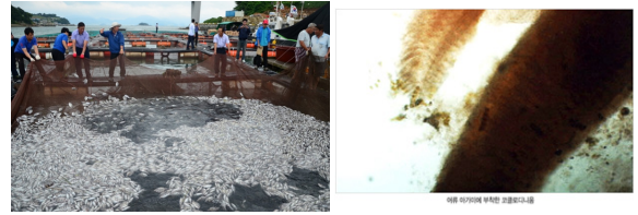
(a) 양식장 어류폐사 모습 (b) 아가미에 부착된 코클로 디니움 (a) Fall dead fish on a fish farm (b) Cochlodinium P. on branchiae

우리나라 수산업에 피해를 주는 해양재해로는 적조발생, 기름유출, 태풍과 같은 자연재해 및 기타 재해 등이 있다. 국내 연안에 오염이 증가할수록 적조의 발생 또한 증가하고 있으며, 적조발생에 최적의 기상여건이 형성되면 양식장 및 수산업에 대량의 피해를 입히고 있다. 다음 그림 2는 2012년 8월 여수 가두리 양식장에 발생한 유해적조에 의한 폐사한 양식어류와 유해적조가 아가미에 부착해 어류를 폐사시키는 모양이다 7) .