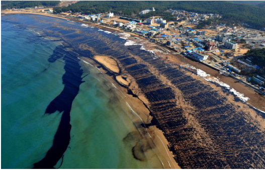
그림 3. 허베이 스프린트 호 원유 유출 사고 Fig. 3. Oilspill of HEBEI SPIRIT

박옥현 외 등은 랑그라지 동력학 이론을 적용한 해양에서의 기름확산 예측 방법을 연구하였다. 이들의 연구는 단지 이론적인 연구에 제한되었으며, 실제 해양환경에는 적용 하지 않았다 12) . 김혜진 등은 경기만과 여수 지역의 유출유 방제 업무 지원을 위한 환경 민감도 정보를 GIS(Geographic Information System) 데이터베이스로 구축하고 GIS 프로그램을 개발하였다 13) . 양찬수 등은 인공위성 원격탐사 자료와 수치모델을 이용한 해상 유출유 예측의 향상에 대하여 연구하였다. 이들은 3차원 수치모델을 이용하여 2007년 12월 태안에서 발생한 허베이 스프리트 호의 유출유 이동을 예측하여 초기 모델과 비교하여서 더 개선된 결과를 보였다 14) .