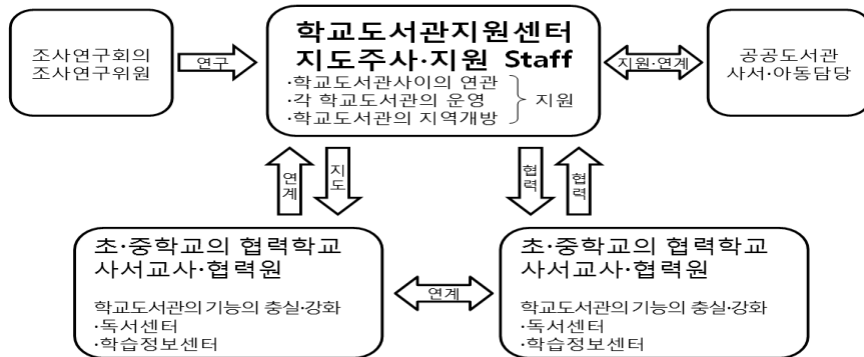
〈그림 3〉 학교도서관지원센터의 개념도

각지자체의 교육센터 혹은 공공도서관에 “학교도서관지원센터”를 설치하고 학교도서관사이의 연계, 각 학교도서관의 운영, 학교도서관의 지역개방 등을 지원하며, 학교도서관 지원센터를 중심으로 공공도서관과 연계하고 지원 받을 수 있도록 설계하고 있다. 특히 학교도서관지원센터는 각 파트별로 전담인력을 배치하여 보다 원활한 협력이 가능하도록 구상하고 있는데 학교도서관지원센터에는 학교도서관지원에 관한 총체적인 업무를 담당할 스태프를 학교도서관에는 학교도서관지원센터와의 세부적이고 실무적인 작업을 담당할 협력인력 33) 을 배치하도록 하고 있다.