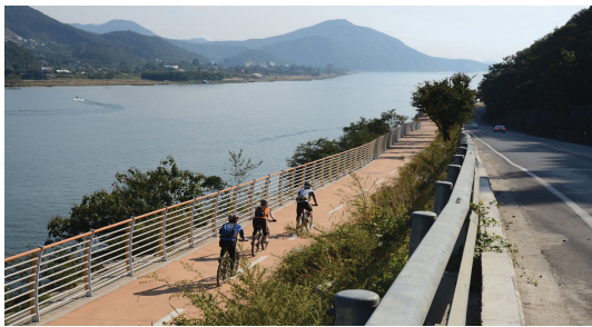
그림 1. 경관도로정비사업 시범구간 : 경기도 남양주시, 국도45호선)