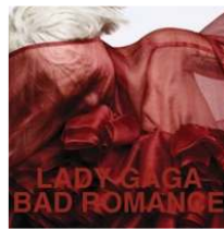
<Figure 7> Bad Romance Album