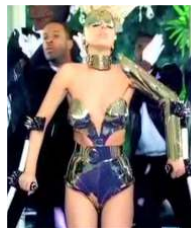
<Figure 16> Paparazzi, 2009