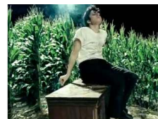
<그림 31> You & I, 2011