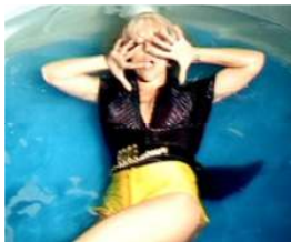
<그림 26> Just Dance, 2008

또한, 레이디 가가는 남성 복장으로 남장을 하였는데 <Figure 31>, 이와 관련해 가버(Garber)는 이성의 옷을 입거나 태도를 취하는 것을 의미하는 용어로 ‘트랜스베스티즘(transvestism, 성 도착증)’ 혹은 ‘크로스 드레싱(cross dressing)’이란 단어를 사용하였다. 트랜스베스티즘은 글자 그대로 복식 도착의 행위로, 한 성이 반대되는 성의 복식을 착용하는 것으로서 어떠한 목적이나 효과를 노려 남성은 여성의 의복 아이템을, 여성은 남성의 의복을 착용하는 것이다. 이 트랜스베스티즘을 변태성욕의 일종으로 간주하였으나 최근에는 흔히 볼 수 있는 유행의 현상