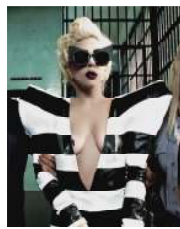
<Figure 17> Telephone, 2010