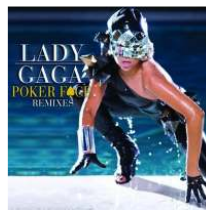
<Figure 3> Poker Face Album