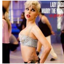
<Figure 14> Marry the Night Album