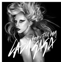
<Figure 10> Born This Way Album