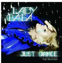
<Figure 1> Just Dance Album

'Eh, Eh'<Figure 4>는 전 연인과 헤어지고 새로운 사랑을 찾는 내용의 노래로, 칼립소스타일(카리브해 지역의 음악)과 중간 템포의 발라드가 돋보이며, 마치 마돈나나 자넷 잭슨의 80년대 후반 ~ 90년대 초반의 큐트 팝송 등을 떠올리게 하는 곡이다. 이 뮤직 비디오는 Joseph Kahn에 의해 제작되고 1950년대 이탈리아계 미국에서 부터 영감을 받았다고 한다. 이 뮤직 비디오에 대해서 가가는 가정적이고 소녀다운 모습의 50년대 미래패션을 형상화하는 본인의 평소와는 다른 모습을 보여주고 싶다고 하였다 29) .