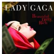
<Figure 2> Beautiful, Dirty, rich Album