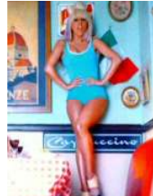
<그림 27> Eh, Eh, 2009