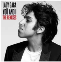
<Figure 13> You & I Album

사회적인 메시지와 파격적인 스토리, 실험적인 영상미, 과감하며 독특한 의상이 돋보였다. 레이디 가가의 뮤직 비디오는 전반적으로 스토리가 있어 한편의 영화 같고, 탄탄한 구성과 파격적이며, 음악과 어울려 자신이 전하고자 하는 메시지와 스타일을 표현하였다.