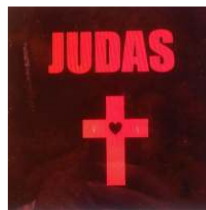
<Figure 11> Judas Album