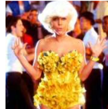
<그림 25> Eh, Eh, 2009