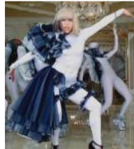
<Figure 24> Paparazzi, 2009