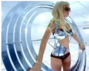
<Figure 15> Bad Romance, 2007

한편, 원초적인 이미지의 프리미티브 스타일은 뮤직 비디오에서 Black이나 White, Red 색상의 코르셋, 가터벨트, 뷔스티에, 브래지어, 팬티, 찢어진 스