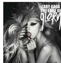
<Figure 12> The Edge of Glory Album