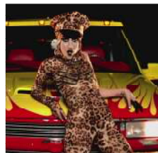
<Figure 19> Telephone, 2010