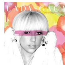
<Figure 4> Eh, Eh Album