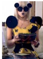
<그림 32> Paparazzi, 2009

신체 부위를 이용할 때는 여성성의 대표 심벌 역할인 가슴으로 표현하였는데, <Figure 33>과 같이 브라지어에 라이플총(Rifle)을 장착시켜 가슴에서 총을 뽑는 장면이다. 이것은 가슴의 과장을 위해 남근의 또 다른 상징인 머신건(Machine Gun)으로 가슴을 은유하였다는 선행연구 50) 와 같이, 여성의 몸이 무기로 쓰일 수 있다는 것을 코믹하게 풀어내어 표현을 하고 있다.