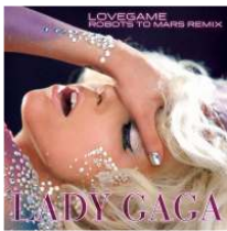
<Figure 5> Love Game Album

‘Telephone’<Figure 8>은 비욘세가 피쳐링으로 참여한 곡으로 영국 싱글 차트에서 1위를 차지했으며, 뮤직 비디오는 공개된 지 12시간 만에 50만 건이 넘는 인터넷 조회 수를 기록하였다. 2010 MTV 비디오 뮤직 어워즈(VMA)에서 이 곡으로 베스트 협동상을 수상하며, ‘Bad Romance’와 함께 총 8개 부문에서 수상하였다. 이 뮤직 비디오는 ‘Paparazzi’ 스토리와 연결되는 구조로 레이디 가가가 수감되는 장면에서부터 시작한다. 영화감독이자 마돈나의 뮤직 비디오를 연출했던 요나스 아커룬트(Jonas Akerlund) 감독이 한편의 범죄 스릴러 코미디 단편 영화를 보는 듯한 스토리로 뮤직 비디오를 연출하였다. 화려한 색감과 이에 걸맞은 아방가르드하며 팝아트적인 레이디 가가와 비욘세의 패션, 파격적인 살인극과 충격적인 대사, 영상이 이어진다. 미디어