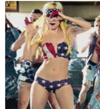
<그림 28> Telephone, 2010