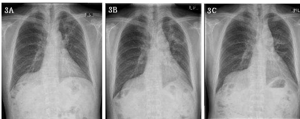
Fig. 3. Changes in chest X-ray of Patient 2 after treatment

그러나 乾嗽가 변화없이 지속되어 당일 본과로 입원하였고, 9월 19일 단순 방사선 흉부 촬영 결과 8월(Figure 3A)에 비하여 좌측 폐 상엽의 방사선 폐렴 의심 부위의 조영증가가 더 확연해짐을 관찰할 수 있었다(Figure 3B). 당일 촬영한 흉부 CT 영상 상으로도 동일 소견을 확인한 후 방사선종양학과 협진을 통하여 스테로이드 요법 시작하였고, prednisolone 30mg daily에서 차츰 15mg-10mg-5mg로 tapering 하여 한달 후 종료