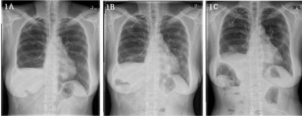
Fig. 1. Radiographic findings of the Patient 1 before and after treatment

1A. Chest X-ray findings in May 2012 during radiotherapy; 1B. X-ray findings in August 2012, multifocal infiltration in both lungs, especially left lower lobe is noted. Saengmaek-san was prescribed for symptom control; 1C. X-ray findings in October 2012, no significant change since last exam.