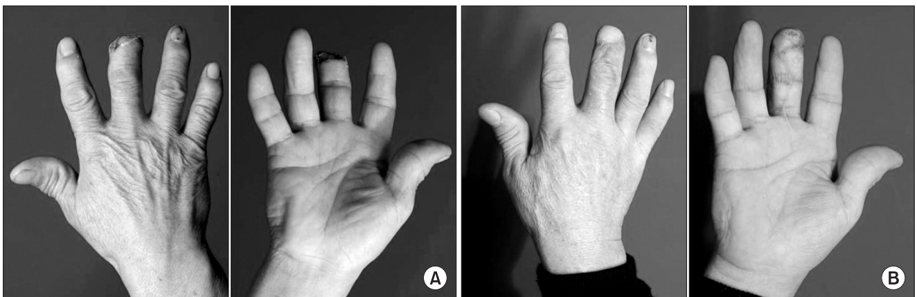
Fig. 3. (A) This 55-year-old male patient visited the clinic due to replantation failure of his right middle finger after debridement. Great toe pulp flap was done. (B) Appearance at 6 months follow-up of this patient.