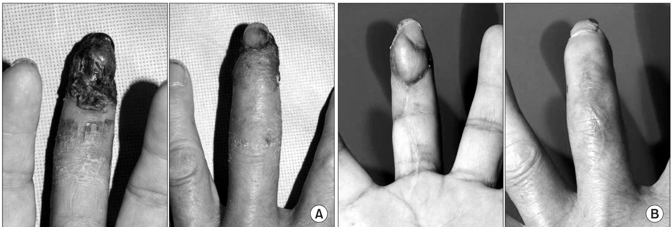
Fig. 2. (A) This 52-year-old male patient visited the clinic due to replantation failure of his right middle finger. (B) Medial plantar artery perforator flap coverage was done and he satisfied the result at 12 months follow-up after operation.