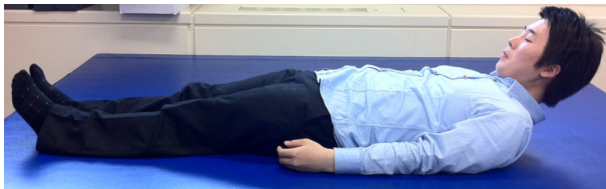
Figure 1. Method of Shaker exercise

Shaker 운동은 등척성 운동만을 시행하였으며 바로 누운 자세에서 시작하여 머리를 발끝이 보일 정도로 충분히 들어 올려 60초 동안 유지하는 것이다(Figure 1). 검사를 시행하기 전 목 들기 각도를 대상자에게 구두 및 그림으로 제공하였으며 각도는 기존 방법인 발끝보기(경부 굴곡 30°)에서 Eiichi et al.(2007)의 연구를 기반으로 가장 낮게 머리를 들어 올리는 턱 당기기(경부 굴곡 15°)와 최대한 머리를 많이 들어 올리는 최대 굴곡(경부 굴곡 50°)을 추가하였다. 각 각도의 측정은 관절 각도계로 숙련된 한 명의 작업치료사가 시행하였다.