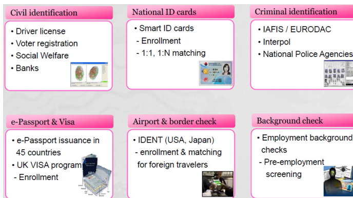
(그림 3) 적용사례 [6]

인도의 경우 UID(Unique Identification)프로젝트를 통해 전국민을 대상으로 Unique ID를 발급하고 Biometric data(face photograph, ten fingerprints, iris) 를 등록하고 있으며 시장규모는 수십억불 이