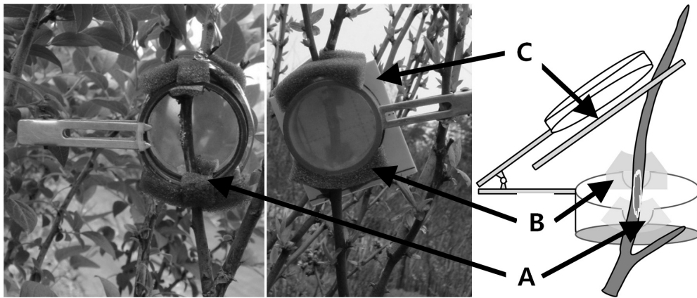
Fig. 1. Modified clip cage for investigating the emergence of Ricania sp. nymphs from overwintered egg mass on blueberry. A: Groove for twig, B: Sponge to block gaps between twig and groove, C: Sticky trap.