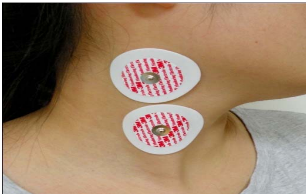
Fig 3. Electrode of sternocleidomastoid