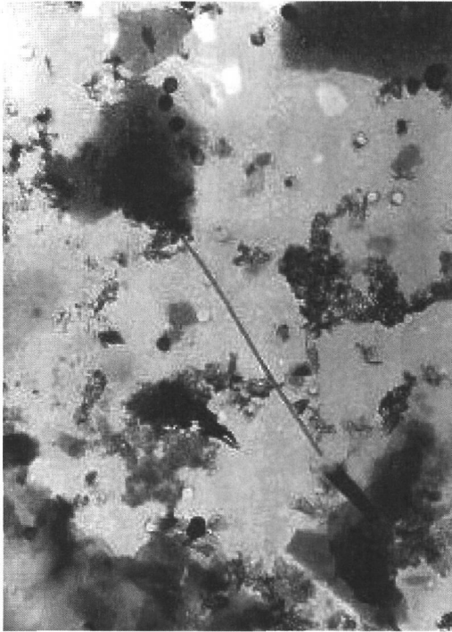
〈그림 2〉 섬유유 폐조직을 투과전자현미경으로 15,000배의 배율에서 촬영한 것

석을 통한 원소조성과 전자회절상을 이용한 결정구조를 파악하여 석면여부를 확인하고 계수 및 평가한다.