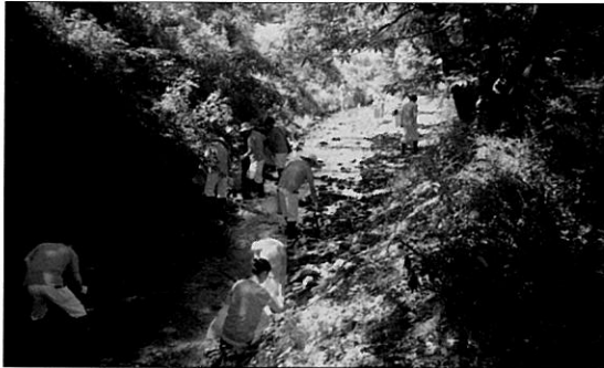
경안천을 살리기 위하여 1회사1하천 살리기운동을 전개하고 있는 모습

맑은물지킴이 활동은 지천을 중심으로 내집앞 하천 지키기 운동을 전개하고 있으며, 용인시 및 광주시 등에서 회원 40명이 활동을 하고 있다.