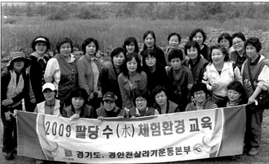
경안천살리기운동본부에서 시행한 팔당 체험환경 교육을 마치고

죽음의 하천에서 철새의 낙원으로 경안천이 변화하고 있다. 경안천에서 큰고니를 비롯해 두루미, 황조롱이, 청둥오리, 새호라기 등 조류 60여종이 발견되고 있다. 철새들이 찾는다는 것은 그만큼 물이 깨끗하고 먹이가 풍부하다는 증거이다.