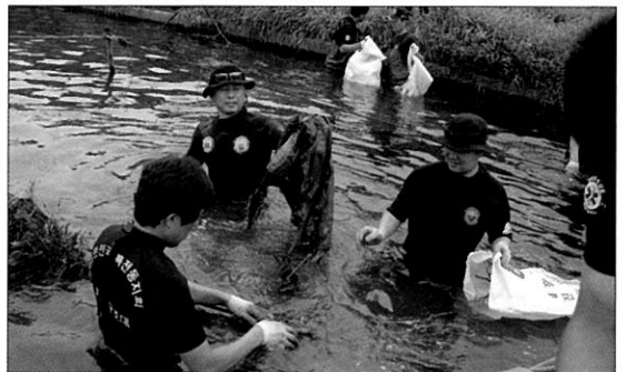
경안천 수중정화활동중인 회원들

수중정화활동은 해병대전우회와 특전동지회에서 보트를 이용하여 물속에 있는 쓰레기를 청소하는 활동을 한다.