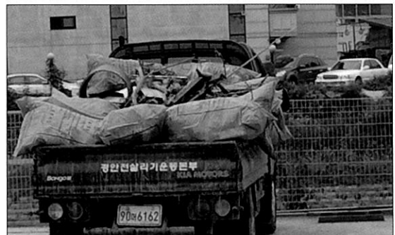
하천변 쓰레기를 치우는 기동반의 활동사진

경안천 기동반을 경안천 수계를 중심으로 수시로 운영하고 있으며, 불법낚시에 대한 계도 및 쓰레기 버리지 않기운동을 홍보하며 경안천 순찰 및 계도 활동을 하고 있다.