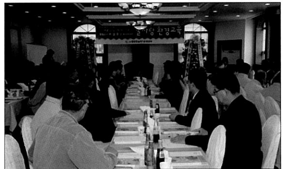
이름다운 하천만들기를 위하여 전문강사를 초빙하여 강의를 듣고 있다.

경안천 기동반을 경안천 수계를 중심으로 수시로 운영하고 있으며, 불법낚시에 대한 계도 및 쓰레기 버리지 않기운동을 홍보하며 경안천 순찰 및 계도 활동을 하고 있다.