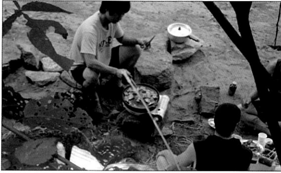
물가에서 고기를 구어먹는 사람들, 건전한 여가활동하는 사람들의 눈살을 찌뿌리게 한다.

맑은물지킴이 활동은 지천을 중심으로 내집앞 하천 지키기 운동을 전개하고 있으며, 용인시 및 광주시 등에서 회원 40명이 활동을 하고 있다.