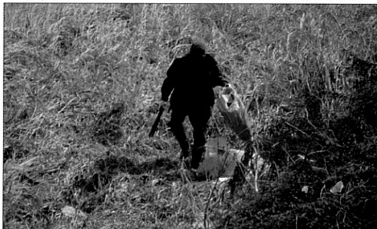
맑은물지킴이 활동중인 회원

느티나무환경교육은 각학교 환경동아리반 신청학교 중심으로 1년간 실천계획을 세워 이론과 실천을 함께 할 수 있는 교육을 하고 있다. 느티나무환경교육이 일회성으로 끝나지 않도록 1년동안 활동할 계획을 정하고, 계획에 따른 정화활동, 유해식물제거 작업, 기후교육, 생태교육을 함께 하고 있