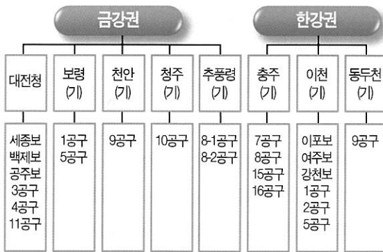
대전지방기상청 4대강 살리기 공사현장 기상지원 기관 현황

대전지방기상청에서는 천과 소속기상대 8개 기관에서 한강과 금강권 6개 보를 포함한 24개 공구에 대해 기상지원을 실시하였으며, 그 대상은 아래와 같다.