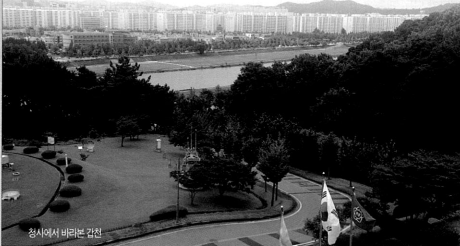
청사에서 바라본 갑천

여기 대전지방기상청에 방문하는 사람들이면 인사처럼 건네는 한마디가 있다. “참 좋은 곳에서 근무하시네요.” 아마도 앞이 탁 트인 청사의 전경을 두고 하는 말일 것이다. 하늘을 바라보고 일해야 하는 예보관의 숙명처럼, 그 보금자리는 도시 외곽의 하늘과 가까운 언덕에 자리 잡아 뒤로는 성두산이, 앞으로는 갑천이 흐르는 그야말로 자연과 어우러진 풍경이다. 산에서 불어오는 상쾌한 공기도 좋지만, 사무실 창가에서 내려다보는 갑천은 물줄기의 흐름을 보고 있는 것만으로도 심신의 휴식을 준다. 하천과 가까이 있기에 누리는 혜택은 비단 이뿐만이 아니다. 천변에서 휴식을 즐기고 있는 사람, 자전거를 타거나 혹은 천천히 산책을 하는 사람, 돌다리를 건너며 동심에 젖는 사람 모두 하천이 주는 혜택을 고스란히 받고 있는 것이다.