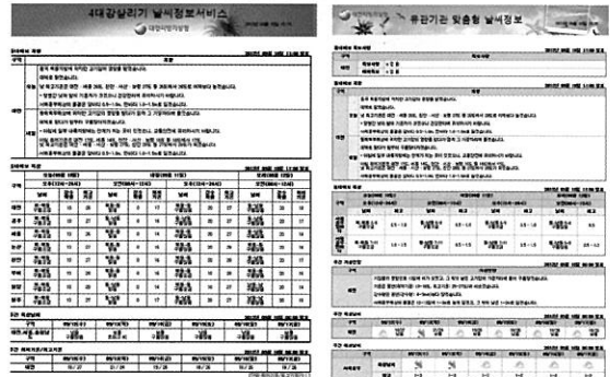
4대강 살리기 사업현장 맞춤형 통보문

2. 맞춤형 기상통보문을 현장 관리자에게 E-MAIL로 제공하였다. 앞서 소개한 것처럼, 맞춤형 통보문은 기존의 일반적인 내용과 지역의 틀에서 벗어나 현장에서 필요한 정보로 구성 되어 있다. 구성 정보로는, 현장과 가장 근접한 곳의 기상상황, 현장 및 상류지역의 단기·주간예보, 3시간 단위의 예보, 산업기상정보 등이 포함되어 있다.