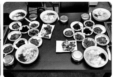
▲ 부녀회에서 운영하는 식당 백반