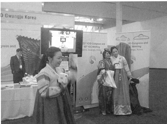
그림 3. 2014 광주 ICID 홍보 부스와 전통의상 체험을 즐기고 있는 관람객

Group 회의 그리고 2일간의 심포지엄이 개최되었으며, 63차 집행위원회가 개최되었다. Working Group 회의에는 예년과 같이 참석자들이 각자 맡은 회의에 적극적으로 참석하면서 적극적인 학술 및 관련 지식, 정책 교류를 하였으며, 심포지엄에는 참석한 교수들과 연구원, 대학원생들이 10여 편에 달하는 논문을 발표하면서 학술교류를 하였다. 이번 호주 회의의 내용을 요약하면 표 1 과 같다.