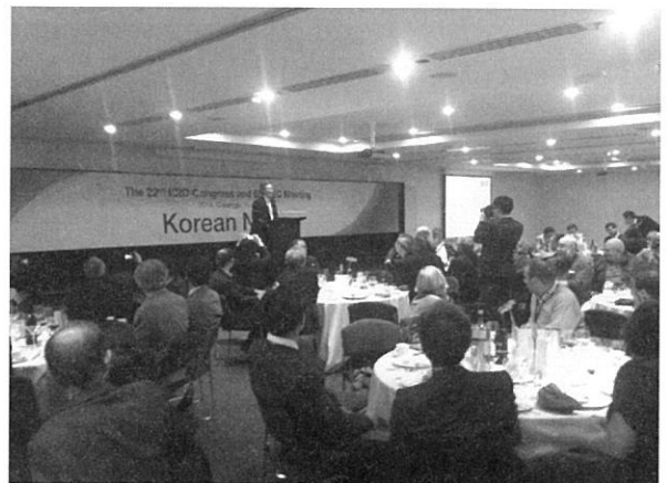
그림 2. 2012년 호주 ICID 아시아지역회의의 “한국의 밤” 행사 광경과 개회사를 하고 있는 한국농어촌공사 농어촌연구원 정해창 원장