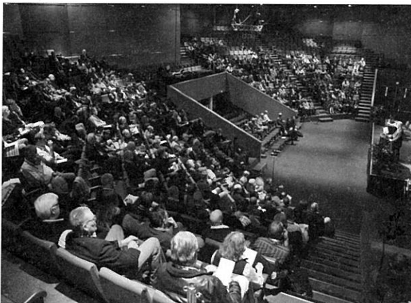
그림 1. 제7차 ICID 아시아지역회의의 개회식

2012. 6. 26(화), 호주 아들레이드 컨벤션 River Bank Hall에서 2014년 ICID 광주총회 홍보를 위한 한국의 밤 행사가 개최되었다. 이번 행사는 ICID회장단과 각국대표단을 초청하여 총 26개국 105명이 참석한 가운데 (사)한국해외농업협회 어대수 부회장의 사회로 진행되었으며, 김태철 ICID 부회장의 환영사, Gao Zhanyi ICID회장의 축사를 시작으로 광주홍보동영상과 KRC홍보영상 등을 소개하고, 한국 문화의 우수성과 KRC의 기술을 널리 알리는 홍보의 장으로써 2014년 ICID 광주총회 참석을 당부하며 성황리에 행사를 마쳤다. 한국의 밤 행사에 초청된