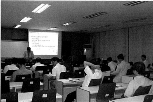
CPD 교육 장면