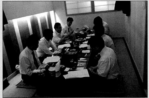
10월 이사회 장면