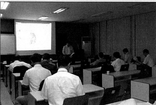
9월 위원장회의 장면