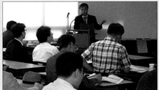
CPD 교육 장면