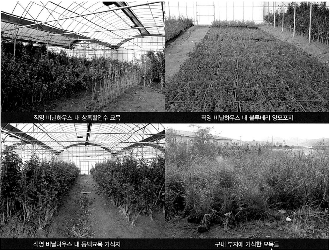
직영 비닐하우스 내 상록활엽수 묘목

순천 시내에서 순천만 관광지로 가는 가장 빠른 유일한 도로인 청암대학 사거리에서 남쪽 순천만 방향으로 1.5km 지점 도로변에 자리한 사무실은 하얀 비닐하우스 아홉 개 동이 나란히 연결되어 있고 앞에 30평형의 흰색 조립식 단층 건물이 아담하게 자리한 가운데 부지에는 각종 조경수들이 가식되어 있고 비닐하우스 안에는 동백 등 상록 활엽수들과 블루베리 어린 유묘들이 양묘 상자에 담겨 주황빛 단풍으로 물들어 가고 있다.