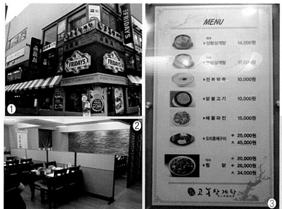
① 고봉삼계탕 외부 전경 ② 고봉삼계탕 내부 ③ 메뉴판