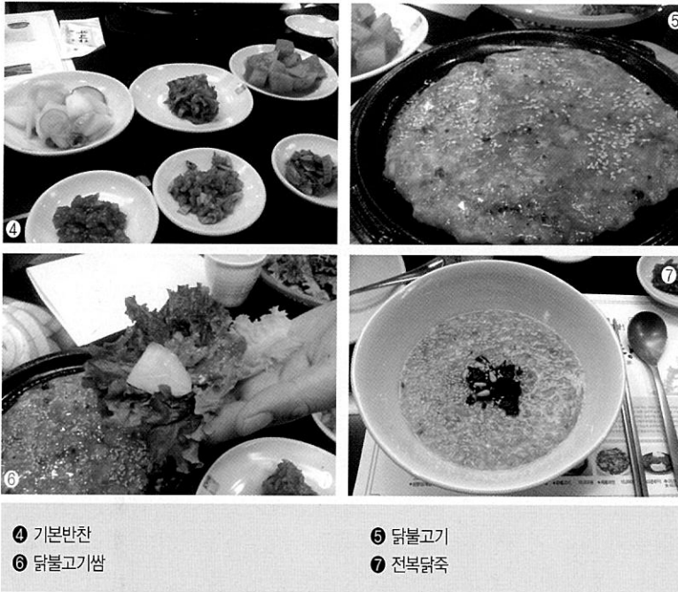
4 기본반찬 6 닭불고기쌈