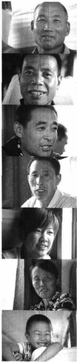
가차안에서 만난 중국인들

였다. 중국의 택시기사는 여러 곳에 전화를 해보고 4성급 호텔을 구했는데 가격이 생각보다 비싸다는 생각이 드는 차에 한국에 부탁한 친구가 마침 여행사에서 미리 예약한 3성급 호텔이 있어서 그 곳에 체류를 하면서 중국에서의 여행일정을 마무리 하였다.