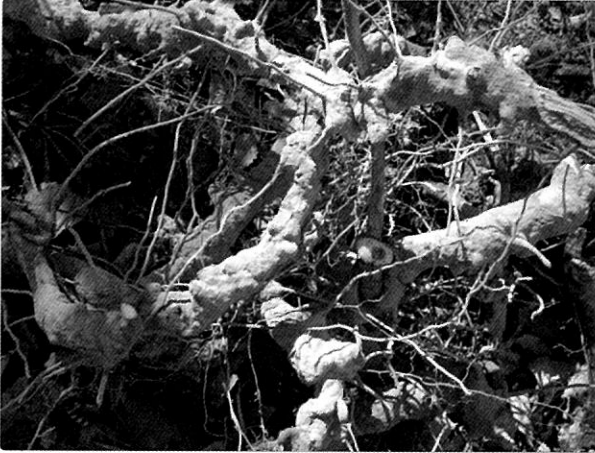
대전대학교 한의과대학 신계내과학교실, 이흥진 등, 대전대학교 한의학연구소(2008년 6월 30일), “인동(忍冬)이 Monosodium Urate로 유발(誘發)된 백서(白鼠)의 통풍(痛風)에 미치는 영향(影響)”

본 논문은 인동 (LC)이 monosodium urate로 유발된 백서의 통풍에 미치는 영향에 대한 것으로 주요 내용은 다음과 같다. Monosodium urate로 통풍이 유발된 백서에 LC (50, 500mg/kg)을 5일 동안 전처리하고 혈청 내 알부민, 글로불린, AST (glutamate dehydrogenase), ALT (glutamate pyruvate transaminase), BUN (blood urea nitrogen), 크레아티닌, 요산, 크산틴 산화효소 활성, ESR(Erythrocyte Sedimentation Rate), WBC, 혈소판을 측정하였다. 그 결과, LC 투여군은 대조군과 비교하였을 때 통풍성 관절염 크기, 혈청 알부민이 감소하였고 500mg/kg LC 투여군에서 혈청 글로불린, AST, ALT이 대조군과 비교하였을 때 감소하였다. 500mg/kg과 50mg/kg LC 투여군에서 크산틴 산화효소 활성이 감소하였다. ESR은 모든 LC 투여군에서 대조군에 비해 감소하였으며, WBC, 혈소판은 500mg/kg LC 투여군에서 대조