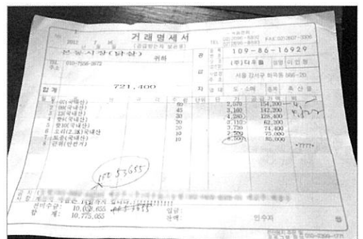
(그림 3) 영업자 준비서류(거래명세서)