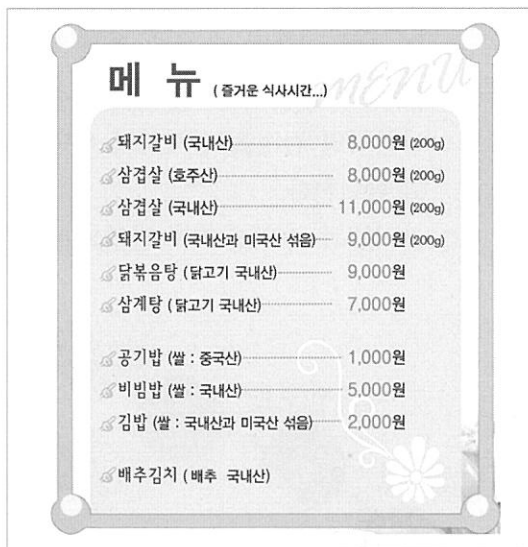
〈그림 1〉 음식점에서의 원산지 표시방법

3) 쇠고기·돼지고기·닭고기·오리고기의 식육가공품을 사용한 경우에는 그 가공품에 사용된 원료의 원산지를 표시한다. 다만, 식육가공품 완제품을 구입하여 사용한 경우 그 포장재에 적힌 원산지를 표시할 수 있다.