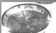
꿀벌 영상잔류독성 조사