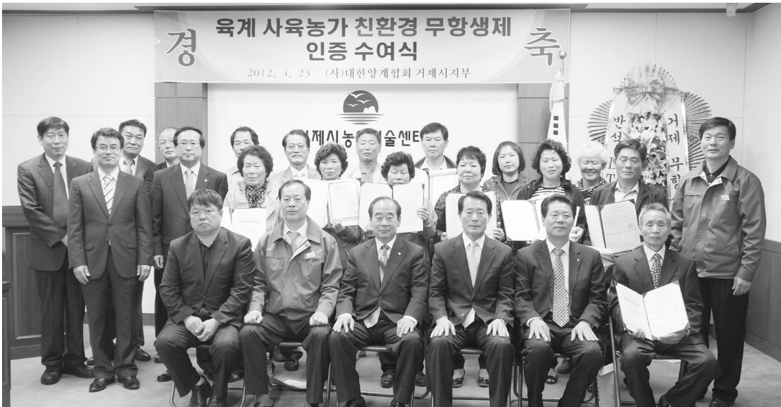
▲ 지난 4월 거제친환경육계농가협의회는 반식LTC와 협약식을 갖고 본격적인 친환경, 브랜드 닭고기 생산에 들어갔다.

생산에서 소비까지 안전한 양계산물을 생산, 공급하는 것은 현 시대에 살아가면서 가장 중요한 일이다. 최근 각종 질병발생과 유전자조작 농산물 생산이 늘어나면서 안전성에 대한 소비자들의 관심은 더욱 높아지고 있다.