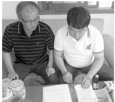
▲ 사후관리 점검(서류검사)