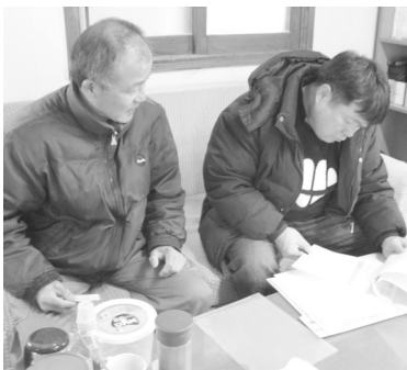
▲ 인증관련 농장의 사양관리일지 등 검사