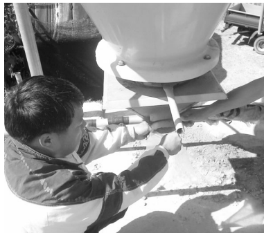
▲ 인증 후 사후관리 점검(시료 채취)