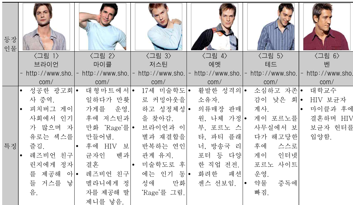
<표 2> 드라마 '퀴어 애즈 포크(Queer as folk)'의 주요 등장인물과 특징

드라마의 제목 '퀴어 애즈 포크(Queer as folk)'는 "사람들처럼 이상한 것은 없다(There's nothing as queer as folk.)"라는 영국의 속담 유래되었다. 58) '퀴어(Queer)'라는 표현은 1980년대부터 미국에서 '게이'와 '레즈비언'이라는 용어를 대신하고 있는데, Tamagne에 따르면 59) 동성애자들은 '이상한 사람', '별난 사람' 혹은 '정신병자'를 가리키는 '퀴어'라는 용어를 동성애자로 스스로 지칭하면서 정상과 비정상에 대한 의문을 제기하였다고 한다. 극중의 주인공들은 30대의 광고회사 중역, 만화가게 운영인, 포르노 스타, 회계사, 17세의 청소년, 대학교수