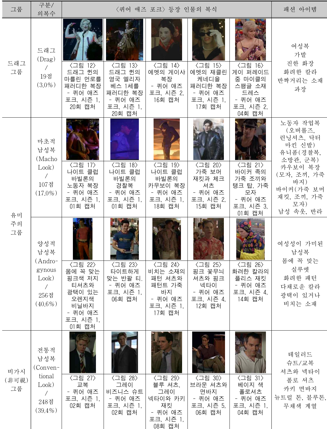
〈표 4〉 드라마 '퀴어 애즈 포크(Queer as folk)'에서 나타난 종족적인 자아 정체성(Tribal Identity) 단계