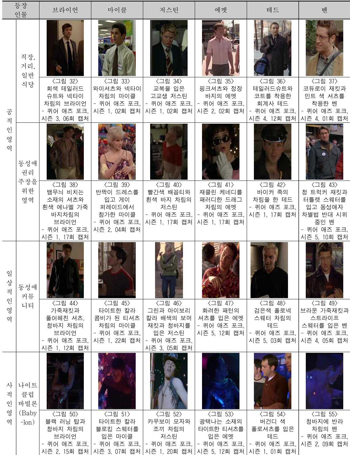
<표 7> 드라마 '퀴어 애즈 포크(Queer as folk)'에서 나타난 상황적인 자아 정체성(Situational Identity)의 단계