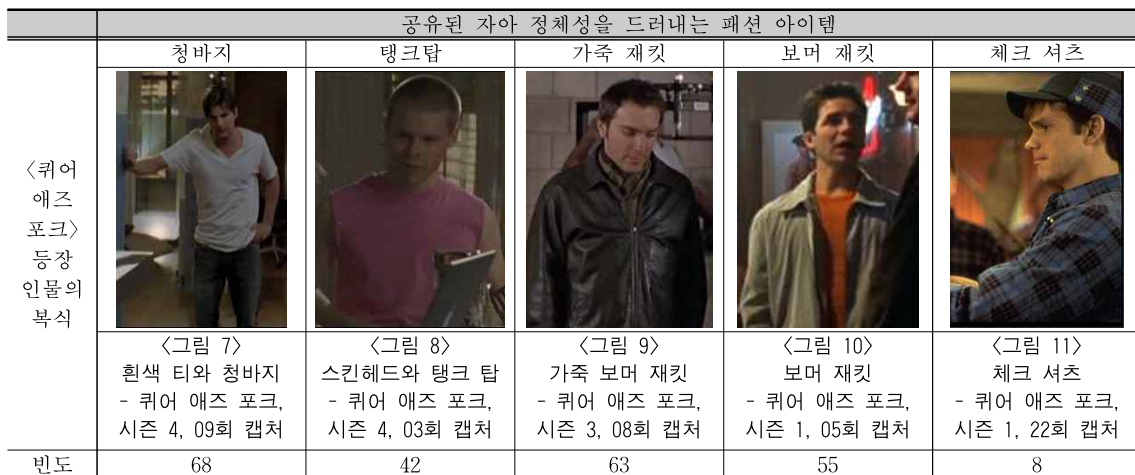
<표 3> 드라마 '퀴어 애즈 포크(Queer as folk)'에서 나타난 공유된 자아 정체성(Tribal Identity) 단계

Cole 61) 에 따르면 19세기 말부터 게이는 동성애 성향(gayness)을 암시하는 상징적인 패션 아이템을 착용해 자신의 동성애 정체성을 밝히고, 성적인 파트너를 찾았다. 일반적으로 동성애자들은 서로를 알아볼 수 있다 62) 고 하는데, 동성애자는 일반인은 인식할 수 없으나, 그들 사이에서는 통용되는 여러 가지 기호들을 개발해 왔다. 20세기 전반에는 여성스러운 느낌이 가미된 남성복, 여성스러운 손짓, 목소리, 걸음 걸이 등이 동성애자임을 암시하는 단서가 되었다. 1980년대 이후 게이는 여성스럽다는 편견에 대한 반작용으로 남성적인 패션 아이템이 동성애 성향의 표