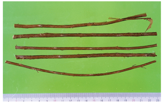
Photo. 1. JoPabNaMu from Korea

코르크층은 3~5 세포층으로 되며, 코르크세포는 직경 5~15×5~10 μm이었다. 피층의 유세포는 직경 10~25 μm이며, 내피는 명료하지 않았다. 섬유는 대량 존재하며, 도관은 직경 15~35 μm이었다. 수의 유세포는 직경 20~80 μm이었다.