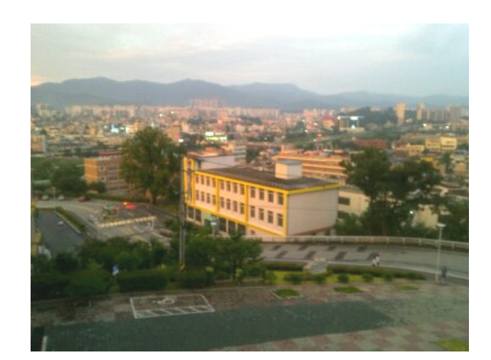
그림 1. 인근 대학교에서 찍은 풍경

이 언덕이라는 지리상 위치 때문에 생기는 불편한 점들 이 많은데 그 중 언덕 위 학교가 으레 그렇듯 학생들이 등교할 때 오르기 힘들다는 점이다. 한참 외모에 관심 많 을 사춘기에 학교를 오르내리기를 반복한 여학생들의 다 리는 나날이 두꺼워지고, 핸드폰 어플 중 하나인 '심심이' 에서는 우리 여학교를 치면 코끼리 양성소라고 말할 정도 가 되었다.