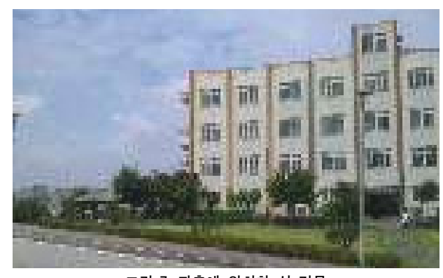
그림 7. 좌측에 위치한 신 건물