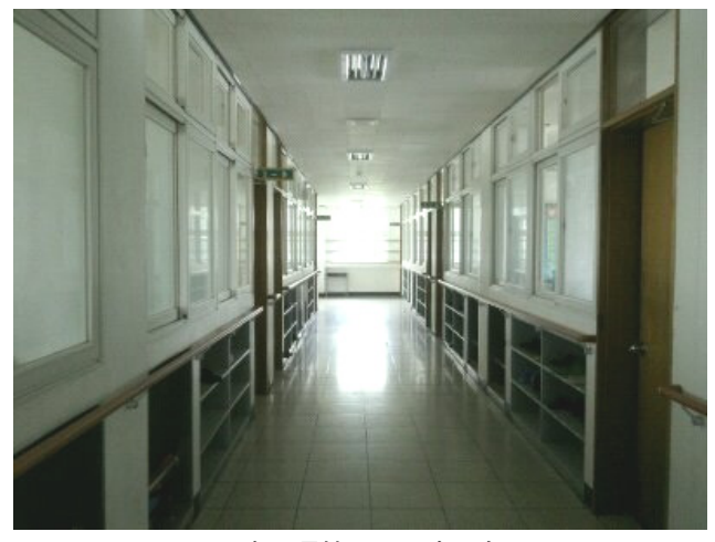
그림 4. 중복도 구조의 모습.

수업 할 때마다 문을 열어두면 다른 반의 수업소리가 건너 반 까지 들려와서 학생들도 선생님들도 불만이 이만 저만이 아니다. 인간이 적응의 동물인지라 학기 초 보다는 많이 익숙해지긴 하지만 건너 반에 목소리 큰 선생님께서 들어오기라도 하시면 그 수업시간이 몹시 괴로워진다. 특 히 우리 반 경우는 1학년 마지막 반이라 주변에 2학년 반 과 붙어있는데, 아침에 영어듣기를 할 때에도 소리가 겹쳐