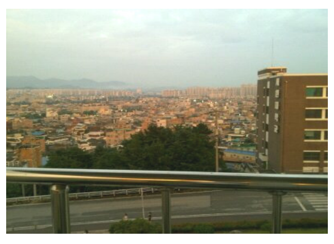
그림 2. 온 시내가 내려다 보이는 학교

그러나 일부 학생들은 공부하는데 필요한 체력을 기르 는데 좋은 것 같다면서 학교의 장점의 하나라고 예를 들 기도 한다.