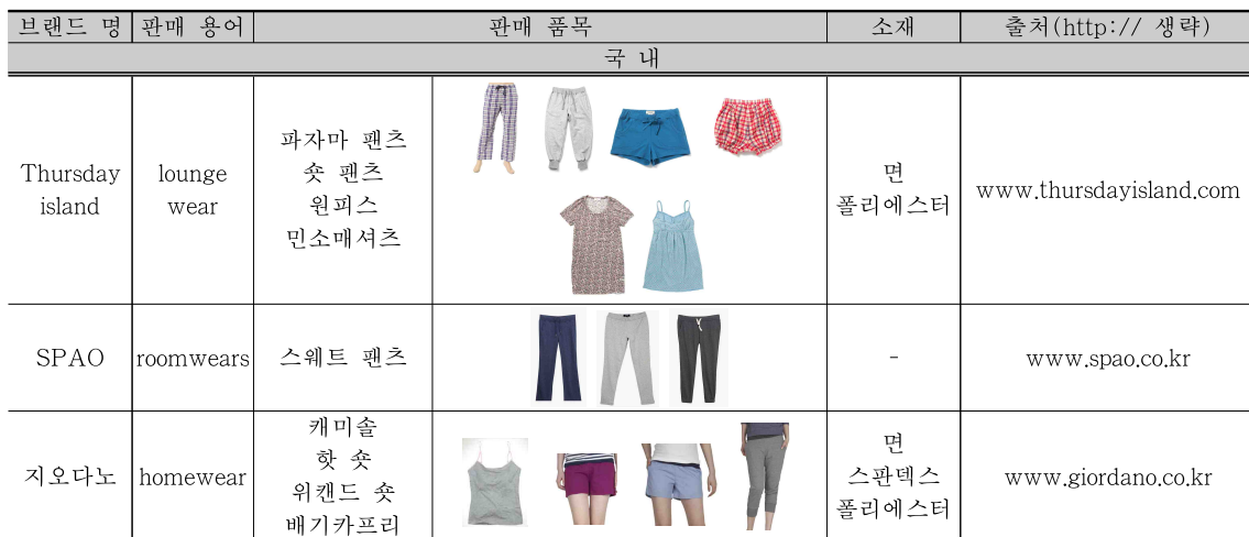
<표 1> 라운지 웨어 판매 브랜드 시장현황(2011년 7월 기준)

최근 슬로우 패션의 하나로 각광받고 있는 오가닉 패션의 확대와 함께 오가닉 의류 소재, 특히 3년간 농약이나 화학비료를 사용하지 않고 재배 생산 19) 된 유기농 면에 대한 관심과 사용이 증대되고 있다. 이처럼 2000년대 후반부터 가시화되고 있는 친환경 마케팅, 브랜드 런칭에 따라 유기농 면 등의 친환경 소