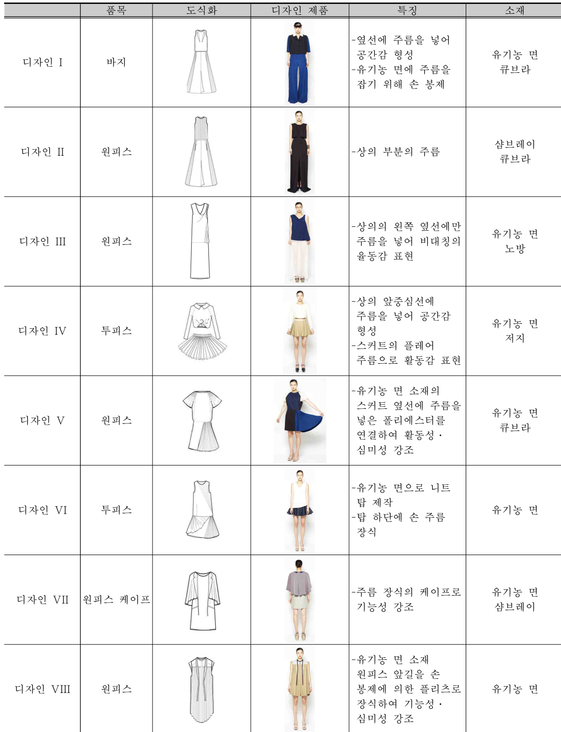
<표 4> 주름 모티브의 라운지 웨어 패션디자인