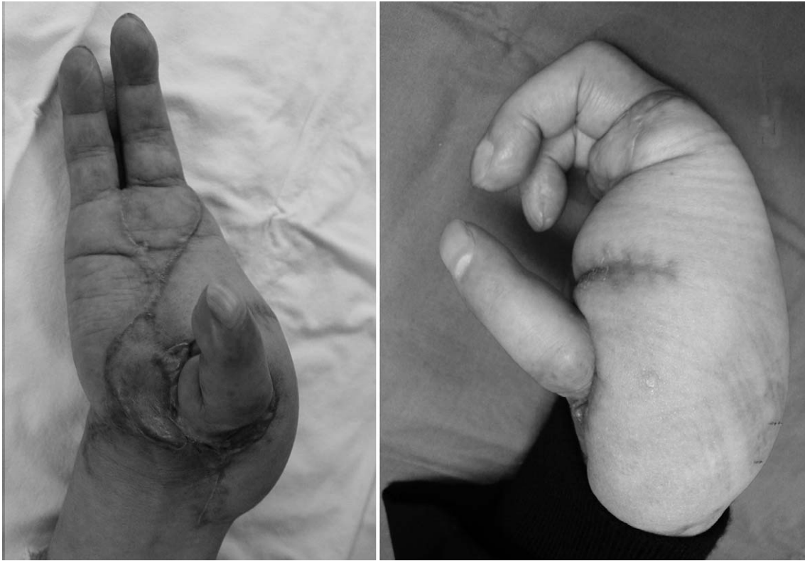
Fig. 5. Postoperative 3 months view, there was no complication and the patient was satisfied with the final result.

장애가 있고, 내전된 수 무지는 파악기능에 장애가 있으며, 너무 길이가 긴 수 무지는 주먹을 쥐었을 때 돌출 되는 현상이 있으므로 이러한 것을 모두 고려하여 수 무지 재건 시 같이 교정하여야 한다 2 .