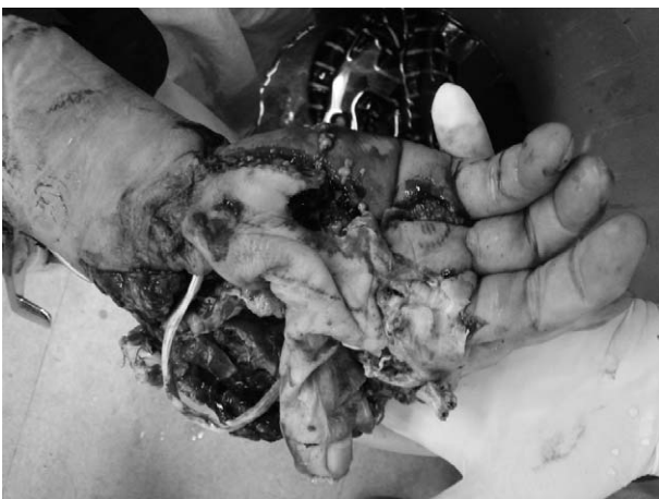
Fig. 1. With severe crushing injury in thumb and index finger, we reconstructed thumb using pollicization with middle finger. We replaced FPL and EPL of thumb with FDP and EDC of middle finger, and did arteriorrhaphy, venorrhaphy like replantation.

54세 남자 환자로 토목 공장에서 사용하는 프레스 기계에 우측 수부의 절단 손상을 입어 내원하였다. 당시 무지, 검지, 중지의 손가락 동맥이 모두 수장골 수준에서 절단된 상태였고(Fig. 1), 특히 무지, 검지는 압쇄손상이 심해서 재접합이 불가능하여 응급수술로 중지를 무지로