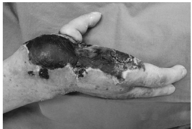
Fig. 2. Postoperative 1 month view, the skin and soft tissues around thumb was necrosed.

수술 후 절대 안정을 원칙으로 하였고 짧은 팔 부목으로 유지하였다. 술 후에 피관의 색깔, 모세혈관 재충전 시간, 지속적 허혈 유무를 관찰하였다(Fig. 4). 경과 관찰에서 특이사항 없었고 피관이 잘 정착되어 수술 후 8일째 퇴원하고 외래에서 경과 관찰하였다. 수술 후 3개월째까지 추적관찰 동안 특별한 합병증은 없었다(Fig. 5).