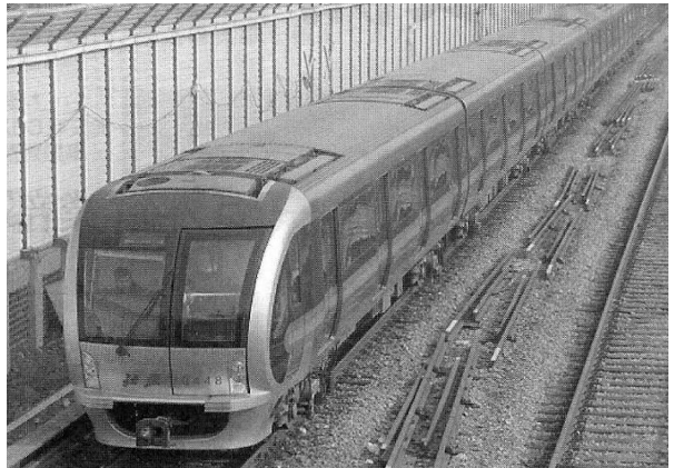
그림 1. 베이징 지하철 1호선 열차편성

2002년 3월에 수주한 1호선은 우한시(武漢市중) 최초 지하철이며, 한코우지구(漢口地區) 종관 역(宗關驛)에서 장안구(江岸區) 황푸루역(黃浦路驛)간을 2004년 7월 28일 개통하였다. 역이 10개소, 영업거리가 10.2km 노선이다. 2010년 7월에 개통한 제 2단계 구간의 증차용 제동장치도 2009년 10월에 수주하였다.