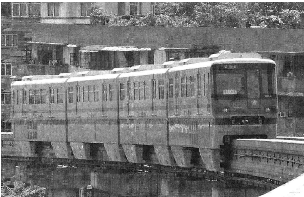
그림 2. 충칭(重慶) 지하철 2호선 모노레일 열차편성

또 2009년도에는 3호선 모노레일 제1단계·제2단계 차량용 제동장치를 수주하여 현지에서 제조하였다.