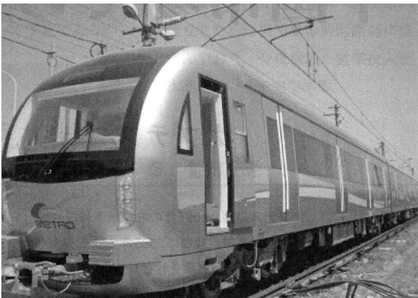
그림 3. 청두(成都) 지하철 1호선 열차편성

2007년 11월에 청두시(成都市) 최초 지하철 1호선 차량용 제동장치를 수주하였다. 이 노선은 북부 다평역(大豐驛)에서 남부 광두역(廣都驛)까지 연결하는 노선이 31.6km나 된다. 23개 역으로서 18개 지하역과 5개 고가역으로 되어 있다. 2010년 9월 27일 영업운전을 개시하였다.