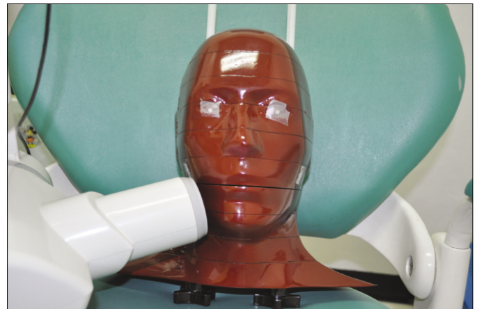
Fig. 4. Wall-type dental X-ray machine (Kodak2200 intraoral X-ray system, Carestream Health, Inc., Rochester, USA).