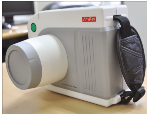
Fig. 3. Portable dental X-ray machine (AnyRay-P, Vatech Co., Hwasung, Korea).