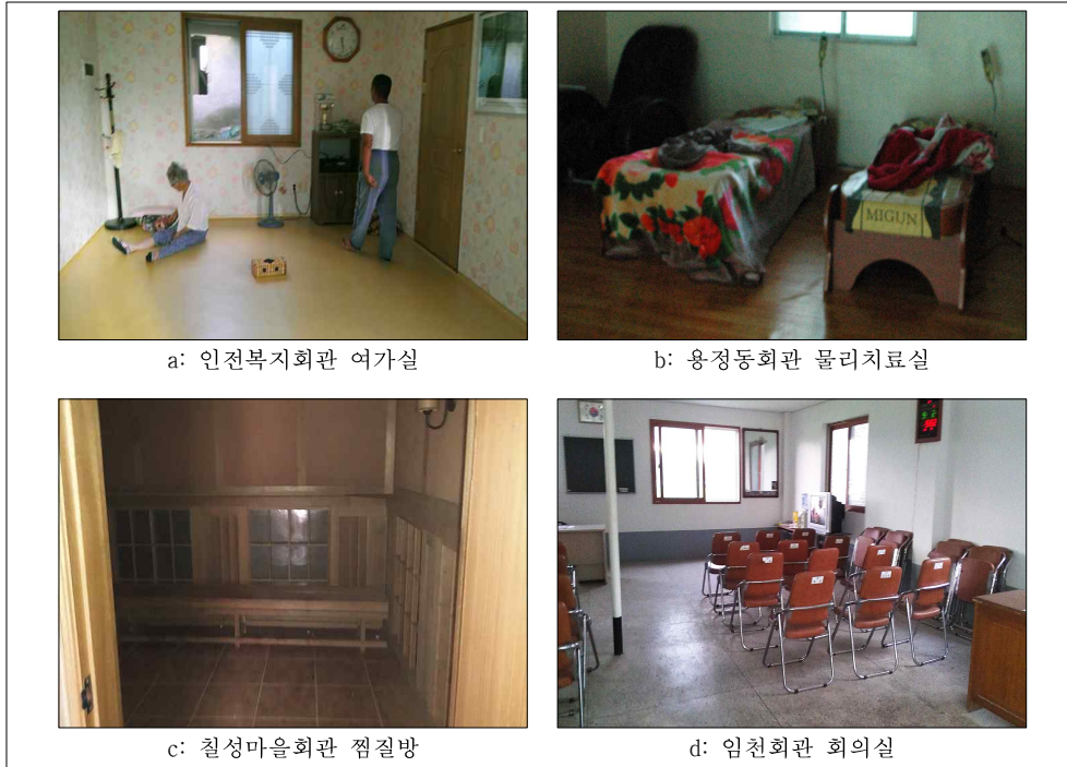
Figure 2 삼랑진읍 마을회관 내부시설 사례