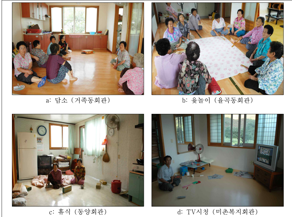
Figure 4 마을회관 이용행태