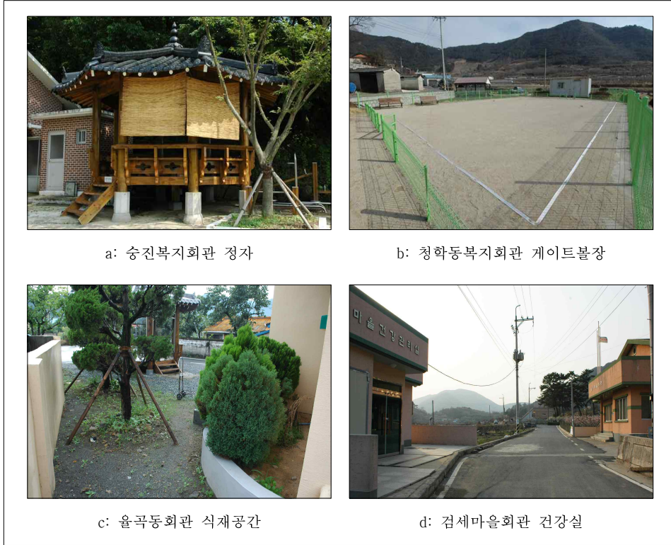
Figure 3 삼랑진읍 마을회관 외부시설 사례