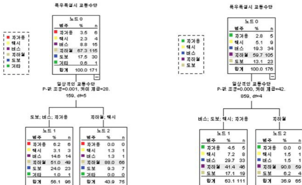
그림 1. 폭우·폭설 시 교통수단 변화(강서구, 서초구)

습관이 가장 영향을 크게 미친다고 응답한 수치는 낮았으나, CHAID분석 결과 평상시 이용하는 교통수단과 기후변화 시 교통수단은 가장 높은 상관성을 보인다(그림 1). 즉 평상시 같은 교통수단을 이용하는 사람들은 폭우·폭설 시 교통수단 선택의 양상이 비슷한 경향을 보인다. 특히 지하철 이용자는 타 교통수단 이용자와 비교하여 기후변화에도 교통수단의 변화가 적은 것으로 나타났다. 이러한 결과를 통해 평상시 이용하는 교통수단이 같은 사람들을 집단으로 묶어 집단 간 서로 다른 교통수단 선택의 규칙을 적용하였다. 교통수단 이용자의 수는 일반적인 통계 수치로 대입이 가능하므로 모델의 운영에 필요한 자료 구축에도 유용하다.