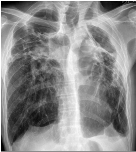
Figure 3. The follow-up chest X-ray after 16 months of treatment (treatment completion). Decreased extent of consolidation and cavitory lesion are seen.

method)에서 4+로 강양성 소견이 관찰되었으나 동일한 객담 및 기관지 세척액의 TB-PCR 검사는 모두 음성으로, 비결핵항산균 폐질환으로 잠정 진단되었다. 이후 항결핵 치료를 중단하고 항산균 배양 결과를 기다리며 경과관찰 하였다. 1달 후 Ogawa 배지에서 항산균 배양 양성 소견 이었고, 이 배양균에 대한 TB-PCR 결과는 음성이었다. 또한 이 검체에 대해 시행한 비결핵항산균 동정 검사에서 Mycobacterium szulgai 가 3회 분리, 동정되었다. 최종적으로 Mycobacterium szulgai 에 의한 폐질환으로 진단되었다.