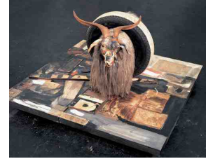
〈그림 4〉 Monogram. Rauschenberg, Robert Rauschenberg, 1955-59 - http://www.artnet.com