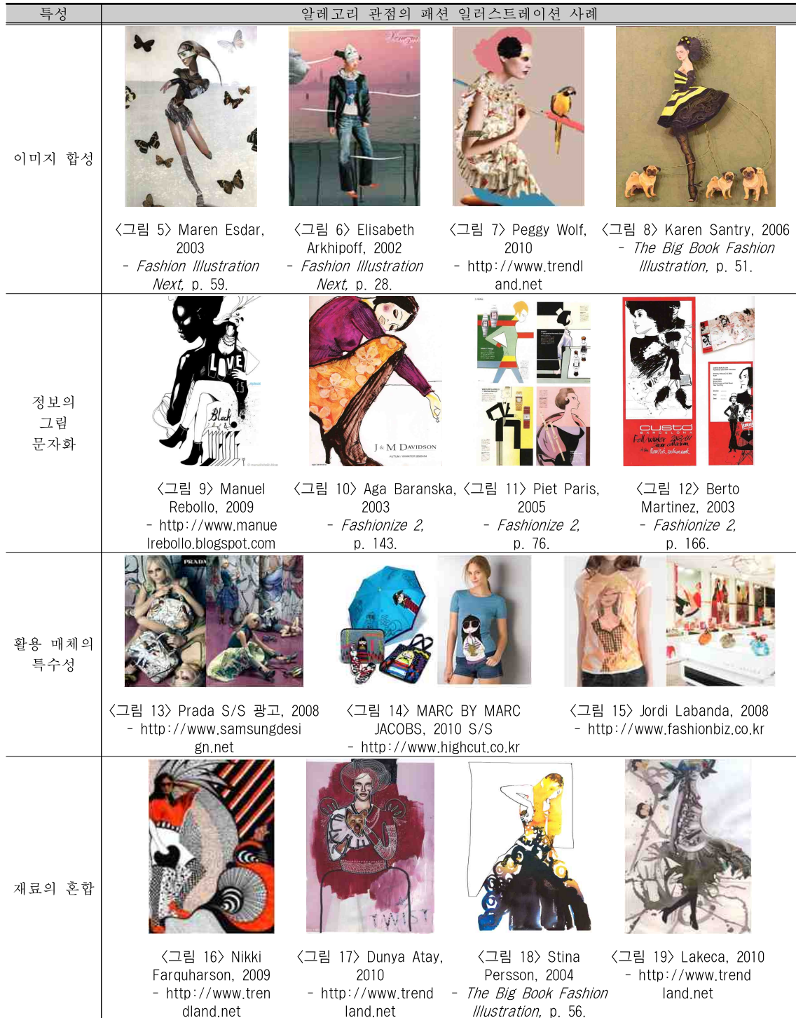
〈표 1〉 알레고리 관점의 패션 일러스트레이션의 표현 특성과 사례