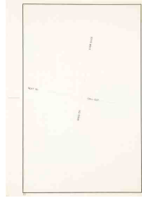
〈그림 2〉 Untitled. Robert Barry, 1978