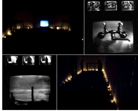
〈그림 1〉 Artful Dodger. Robert Longo, 1976 - http://www.robertlongo.com