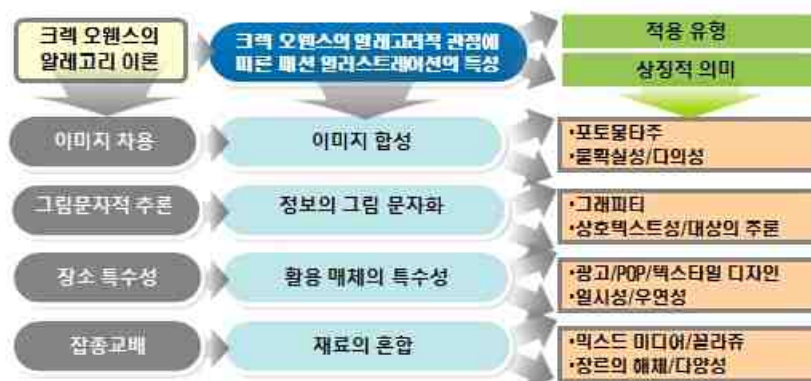
<그림 20> 크랙 오웬스의 알레고리적 관점에 따른 패션 일러스트레이션의 특성

크랙 오웬스의 알레고리 관점에 따른 패션 일러스트레이션의 표현 특성에 관한 연구의 결론은 다음과 같다. 첫째, 알레고리 특성인 이미지의 차용은 패션 일러스트레이션에서 이미지 합성을 나타내고, 컨셉과 관련되어 차용한 이미지가 덧붙여지거나 왜곡되면서 고정적 의미가 해체되고 전혀 다른 의미가 형성되는 의미의 다의성과 불확실성이 나타났다. 둘째, 그림 문자적 추론은 언어적인 것과 시각적인 것의 매체 혼합으로 패션 일러스트레이션에 문자를 활용하여 패션 정보를 시각적으로 내재적으로 전달하려는 정보의 그림 문자화라는 특성을 가진다. 그리고 상호 커뮤니케이션의 기능을 수행하는 상호텍스트성과 그림 문자를 통해 대상을 추론하는 내재적 의미를 가