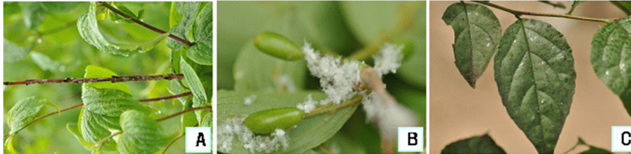
Fig. 2. Ricania sp. damage pattern(A; twig dies due to spawn, B; sap sucking by nymphs and adults, C; inducing a sooty mold).

성충에 대한 살충율은 Table 7과 같다. 몇가지 친환경자재와 살충제를 시험재료로 처리 1, 3일후의 보정살충율을 산출하였다. 님추출물제와 천연식물추출물제는 1일후 70% 이상의 높은 살충율을 보였지만 처리 3일 후에도 큰 차이는 없었다. 친환경자재 중 고삼추출물제가 82.4%로 가장 높은 살충율을 보였다.