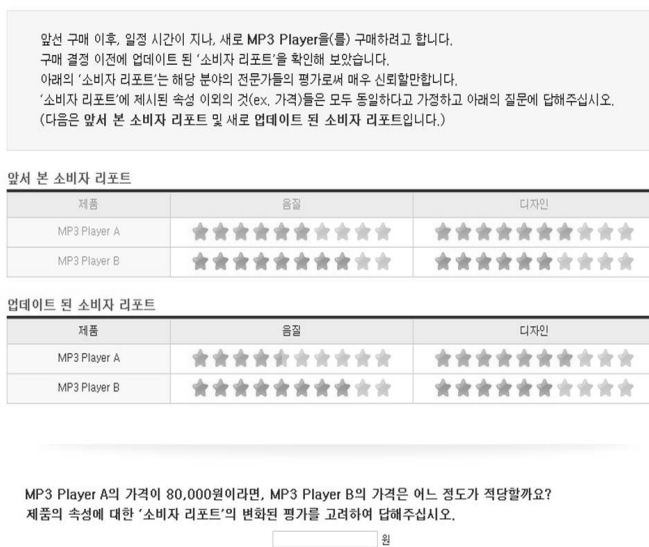
<그림 2> 대안 평가 정보 제시 화면 2단계

학생들이 두 개의 대안 가운데 하나를 선택하고, '다음' 아이콘을 클릭하면, 소속된 실험집단(비선택 대안 악화, 선택 대안 개선)에 따라 선택한 대안 혹은 선택하지 않은 대안에 대한 소비자 리포트의 평가가 변동된 <그림 2>와 같은 화면이 나타났다. <그림 2>는 비선택 대안이 악화되는 집단의 학생이 1단계에서 대안 B를 선택했을 때, 2단계에서 선택 대안인 B는 변화 없으나, 비선택 대안인 A의 음질이 악화된 경우이다.