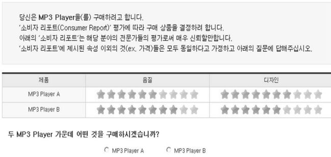
<그림 1> 대안 평가 정보 제시 화면 1단계

학생들이 두 개의 대안 가운데 하나를 선택하고, '다음' 아이콘을 클릭하면, 소속된 실험집단(비선택 대안 악화, 선택 대안 개선)에 따라 선택한 대안 혹은 선택하지 않은 대안에 대한 소비자 리포트의 평가가 변동된 <그림 2>와 같은 화면이 나타났다. <그림 2>는 비선택 대안이 악화되는 집단의 학생이 1단계에서 대안 B를 선택했을 때, 2단계에서 선택 대안인 B는 변화 없으나, 비선택 대안인 A의 음질이 악화된 경우이다.