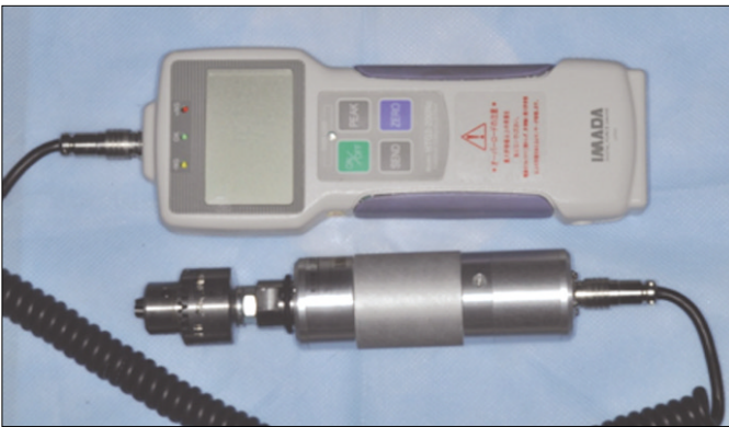
Fig. 2. Digital torque gauge used in this study.

동적 하중을 적용하기 전과 후의 길이를 감하여 임플란트 지대주의 침하량을 계산한 결과, 침하량은 3 군(39.57 ± 34.15 μm), 2 군(22.43 ± 19.26 μm), 1 군(20.86 ± 23.56 μm) 순으로 나타났다 (Fig. 4). 그러나 각 지대주간 침하량을 비교하기 위하여 Kruskal-Wallis test를 시행한 결과 통계적으로 유의한 차이를 보이지 않았다.