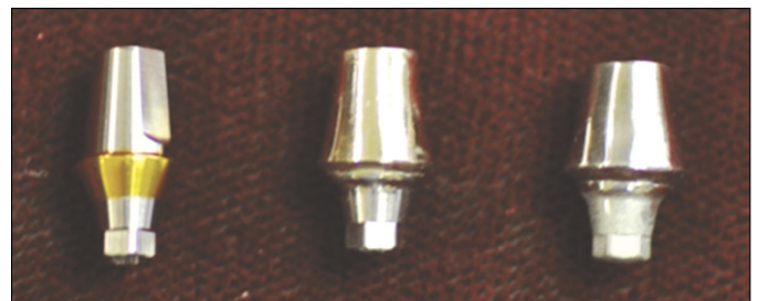
Fig. 1. Abutment specimens of this study.

1 군인 티타늄 지대주는 2 mm의 치은부 높이, 6 mm의 수직고경, 4 mm 폭경의 원추형 지대주를 사용하였다. 2 군과 3 군을 1 군과 유사한 형태로 제작하기 위하여 임플란트 유사체를 석고 모형에 식립한 후 납형을 제작하였다. 이러한 방법으로 각 군마다 1군과 같은 높이와 폭경으로 7개의 납형을 형성하였고 이를 주조하기 위해 인산염계 매몰재(Uni vest non-precious, Shufu Inc., Tokyo, Japan)로 매몰하여 850°C의 온도로 소환 후 주조하였다. 또한 모든 주조체는 50-125 μm 글라스 비드를 21.7-29.0 psi의 공기압으로 분사하여 산화막을 제거한 후 연마하였다. 이 모든 가공 과정은 한 명의 기공사가 시행하였으며 매몰 등 주조 작업에 관한 기준은 해당 제품 제조사의 지침을 준수하였다(Fig. 1).