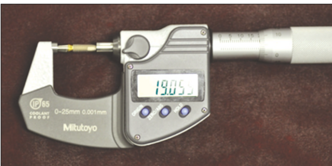
Fig. 3. Measurement of implant-abutment length.