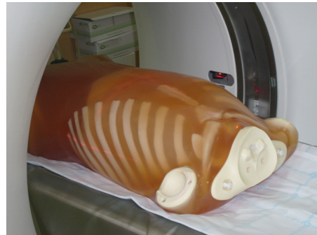
[그림 1] CT 갠트리 위의 인체 팬텀 설치 [Fig. 1] Setting human phantom on the CT gantry

실험에 사용한 CT 장비는 각 제조회사의 64 MDCT를 사용하였다. 사용된 CT 장비의 종류는 LightSpeed VCT (General Electric, GE, USA), Brilliance (Philips, USA), 그리고 SOMATOM Definition (Siemens, Germany) 모델이다. 실험에 이용한 모형은 그림 1과 같이 인체 모형(KUPBU-50, Kyoto Kagaku Co. Ltd, Japan)으로 실물크기의 내장형 침단 합성 골격, 폐, 간, 종격과 신장으로 구성된 인체 등가 모형이다.