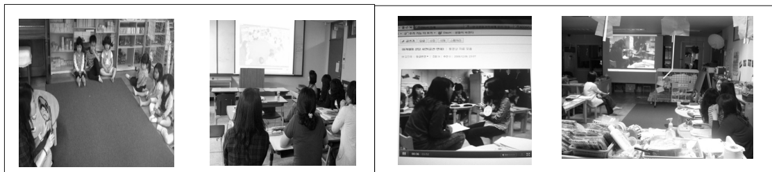
[Figure 3] session 6 teacher practice & analysis of teacher behavior