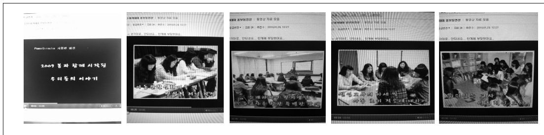
[Figure 2] session 4 & 9 teacher practice & analysis of teacher behavior

예비 보육교사 교육 프로그램 예비안에 대한 개선과 관련하여 프로그램에 참여한 11명의 학생을 대상으로 개방식 질문지를 실시하였다. 질문은 교육내용과 교수 방법, 운영방식과 관련된 개선방안에 대한 것이었다. 그 결과 6명의 학생이 교육에 참여하는 시기가 3학년부터 시작되었으면 좋겠다는 의견을 제시하였다. 또한 7명의