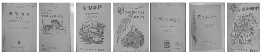
〈그림 3〉 1920-1930년대 농업분야 고려인 문헌