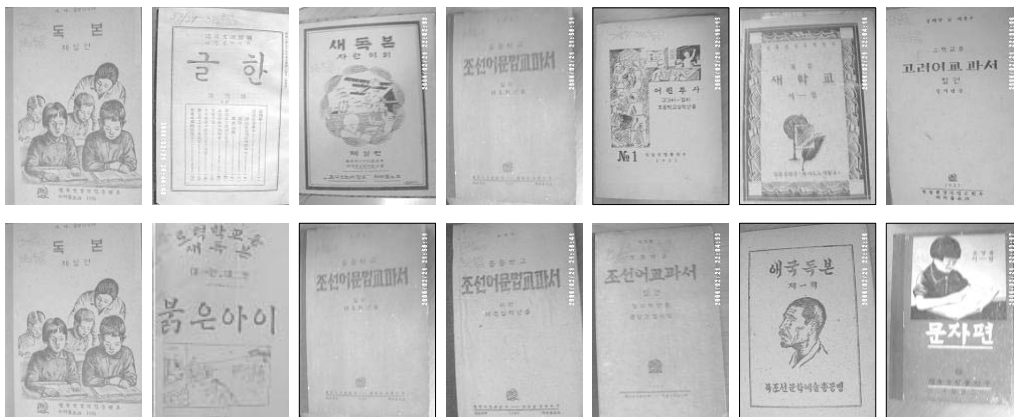
〈그림 2〉 연해주에서 만들어진 한글교육 교재

이들 발행지의 출판사에서는 교육출판물(초중등학생의 고려인 한글교육용 등의 교과서와 사회주의 학습교과서, 사전 등), 지침서(농업, 어업, 축산, 양봉 및 양잠, 광업, 상업, 계획경제 등 직능별 분야에 관한 전문도서), 여성 및 건강, 생활상식 및 문화, 음악 및 문학(희곡집, 문학작품) 등의 도서, 아동도서 등이 출판되었다. 특징으로는 이들 도서들이 대부분 한글문헌이라는 것이다(그림 2, 3, 4 참조).