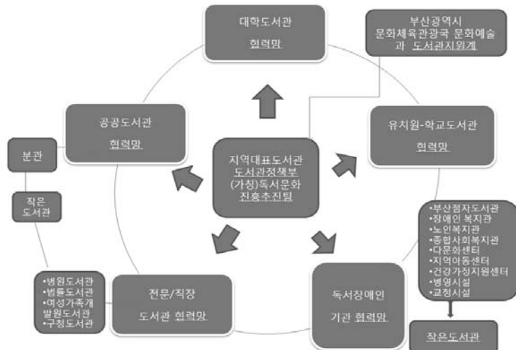
〈그림 2〉 부산광역시 독서문화진흥 협력망

지역대표도서관인 부산광역시립시민도서관의 도서관정책부 내에 (가칭)독서문화진흥추진팀을 구성한다. 이를 위해 예산 및 인력이 보장되어야 한다.