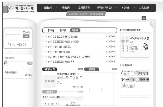
<그림 2> 학생사모 홈페이지

현재 학생사모는 전국학교도서관담당교사모임 10) 의 경남지역모임으로 소속되어 활동하고 있으며, 경남교육포럼의 분과, 전국교직원노조 참교육실천과 연대하여 활동하고 있다. 온라인 회원은 500명 내외, 실질적으로 활동하는 인원은 소모임 중심의 120명 내외이다.