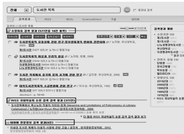
〈그림 1〉 P대학도서관 목록의 검색 결과 화면

이러한 조사결과를 좀 더 실증적으로 검증하기 위해 P대학도서관의 목록을 이용한 검색실험을 병행하였다. 물론 한 대학의 사례를 조사하여 일반화시키는 것은 무리가 있지만, 목록이용행태에 있어 면밀히 살펴볼 수 있다는 측면에서 간단한 실험을 시도해 보았다. 구체적으로, P대학도서관의 ① 목록검색 화면에서 제공하는 내용 중에 학생들이 정확히 인지하는 내용은 무엇인지(검색결과에 대한 인지도), ② 인지한 내용 중에서 적극적으로 이용하는 내용은 무엇인지(검색결과의 활용도), ③ 검색된 서지레코드에서 참조하고자 하는 데이터 요소는 무엇인지(검색된 서지레코드에서 참조하는 데이터 요소), ④ 목록에서 제공하는 추가정보에 대해 어느 정도 인지하고 있는지(검색된 서지레코드의 '부가 항목'에 대한 이해도)에 대해서 살펴보았다. 결론부터 이야기하자면, 실제 목록검색 화면에서 학생들이 보였던 행태는 매우 수동적이고 소극적인 것이었다.