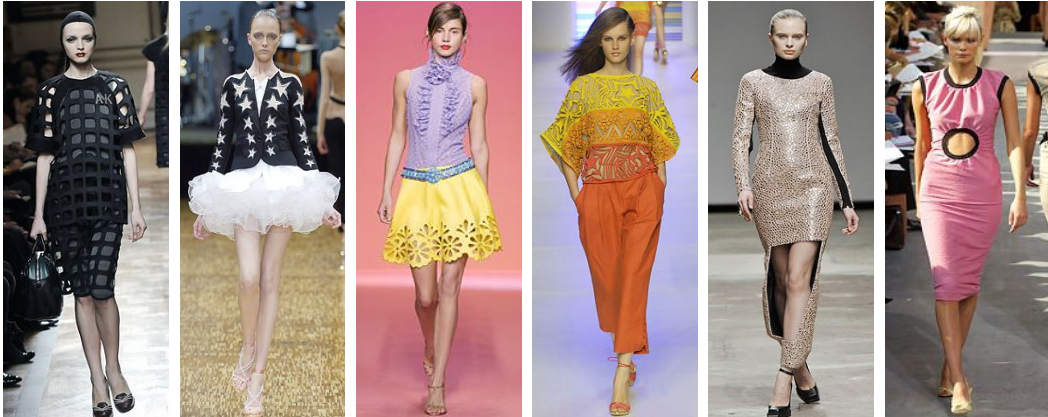
<Fig. 7> Miu Miu. 2008F/W. From Miumiu. (2008). http://www.style.com <Fig. 8> Victor&Rolf. 2007S/S. From Victor&Rolf. (2007). http://www.style.com <Fig. 9> Andrew GN. 2004S/S. From Andrew. (2004). http://www.style.com <Fig. 10> Emilio Pucci. 2008S/S. From Emilio. (2008). http://www.style.com <Fig. 11> Marios Schwab. 2008F/W. From Marios. (2008). http://www.style.com <Fig. 12> Louis Vuitton. 2003S/S. From Louis. (2003). http://www.style.com

양으로 표현되었으며, <Fig. 10>과 같이 레이저 커팅에 의해 의복 공간 전체에 걸쳐 양식적인 문양으로 표현된 경우가 대부분을 차지했다. 또 하나의 단일형태로 표현되어 커다란 공간을 형성하고 있는 컷 아웃은 <Fig. 11>과 같이 원피 아랫부분을 큰 직사각형의 형태로 컷 아웃하거나, <Fig. 12>와 같이 원피스 중앙부분에 둥근 원의 형태로 컷 아웃시켜 공간감을 형성함으로써 시선을 집중시키는 효과를 갖게 하였다. 컷 아웃기법의 경우 반복배열에 의해 문양의 효과를 나타내거나 일부분에 사용함으로써 시선을 한 부분으로 집중시키는 강조의 효과를 나타내기도 하지만, <Fig. 13>과 같이 좌우 대칭된 구조로 배치되어 시선을 집중시키는 동시에 균형적인 이미지를 나타냈다. 깨끗하게 커팅되고 좌우대칭 구조에 의해 모던한 이미지를 느낄 수 있지만, <Fig. 14>와 같이 추상적 문양의 원피스 위에 정확하게 좌우대칭된 구조이지만, 비정형적인 형태로 마치 찢어진 듯한 형태의 컷 아웃된 원피스를 겹쳐 연출함으로써 비대칭구조와 같은 착시의 효과를 표현하기도 하였다. 또 <Fig. 15>와 같이 구멍이 뚫린 것처럼 비정형적인 형태의 자유배치로 그런지 이미지를 표현하기도 하였으며, <Fig. 16>과 같이 허리부분에 컷 아웃되어 관능적 이미지와