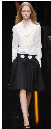
〈Fig. 27〉 Lagerfeld Gallery. 2006S/S.