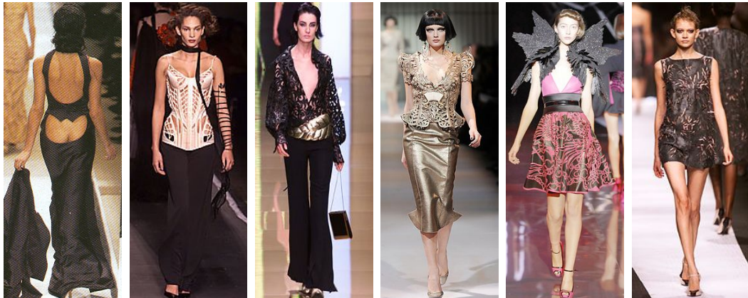
<Fig. 19> Jean Paul Gaultier. 2002S/S. From Jean. (2002). http://www.style.com <Fig. 20> Jean Paul Gaultier. 2001S/S. From Jean. (2001). http://www.style.com <Fig. 21> Valentino. 2002F/W. From Valentino. (2002). http://www.style.com <Fig. 22> Armani Prive. 2009S/S. From Armani. (2009). http://www.style.com <Fig. 23> Alexander McQueen. 2008S/S. From Alexander. (2008). http://www.style.com <Fig. 24> Ruffo Research. 2002S/S. From Ruffo. (2002). http://www.style.com

어 나타나기도 하지만, 가죽이나 비닐 등 울 풀림이 없는 소재를 사용하여 컷 아웃시킴으로써 정교하고 다양한 문양을 나타냈다. <Fig. 2>와 같이 광택 있는 가죽에 정교한 꽃문양으로 컷 아웃된 베스트, <Fig. 21>과 같이 가죽을 마치 레이스와 같은 효과로 정교하게 컷 아웃시켜 표현된 관능적인 블랙 블라우스, <Fig. 22>와 같이 뱀 문양의 가죽을 컷 아웃시켜 조형적인 형태미를 강조한 재킷, <Fig. 23>과 같이 Kiss Cut의 기법으로 두 겹의 소재 중 위 소재 부분만을 커팅하여 스커트 전체에 한 폭의 그림과 같은 문양으로 입체적인 표현을 나타낸 컷 등 대부분 레이저 커팅을 활용하여 정교하고 섬세한 장식의 효과를 나타냈다. 또 <Fig. 24>는 수작업을 통해 가죽을 국화꽃 모양으로 컷 아웃시켜 꽃잎들이 흔들리는 것처럼 표현한 것으로 거친 가죽의 이미지를 화려하고 장식적인 꽃의 이미지로 전환시켜 표현한 것이다.