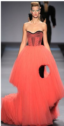
〈Fig. 25〉 Victor&Rolf. 2010S/S. From Victor&Rolf. (2010). http://www.style.com

이와 같이 컷 아웃 디자인을 통한 유희의 표현은 재미와 즐거움을 본질로 하여 사회문화적인 어떠한 중압감, 즉 관습상 합리적으로 생각하도록 길들여진 사고방식에서 벗어나 대중에게 자유를 느끼게 한다. 삶의 긴장 완화로서 심각하지 않은 것, 구