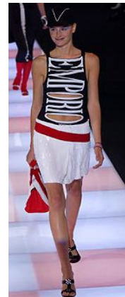
〈Fig. 29〉 Emporio Armani. 2004S/S. From Emporio. (2004). http://www.style.com