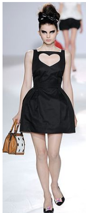
〈Fig. 26〉 Luella. 2010S/S. From Luella. (2010). http://www.style.com