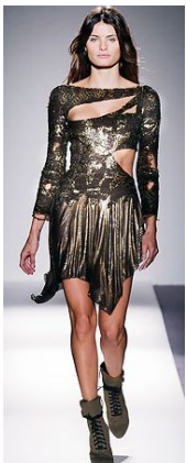
<Fig. 13> Mark Fast. 2010S/S.