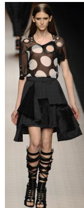
〈Fig. 28〉 Givenchy. 2008S/S. From Givenchy. (2008). http://www.style.com