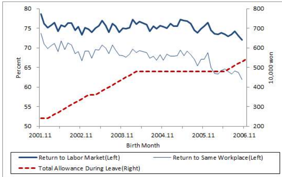
[Figure 3] The Percentage of Women Returning to Labor Market 18 Months After Giving Birth

Note: The return to labor market is defined as being covered by Employment Insurance at a point in time.