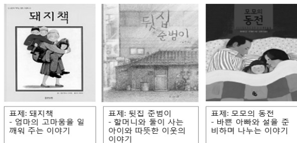
<그림 1> 이야기 중심의 어린이 그림책의 표제와 줄거리 예시

그런데 이러한 그림책을 주제 접근 측면에서 본다면, 기술목록에서 제공하는 서지 정보는 ‘이는 자료(known-item) 검색’이 아닌 경우에 유용성이 크게 떨어진다. <그림 1>에서와 같이, 그림책은 표제를 이용한 주제 접근이 어렵다.