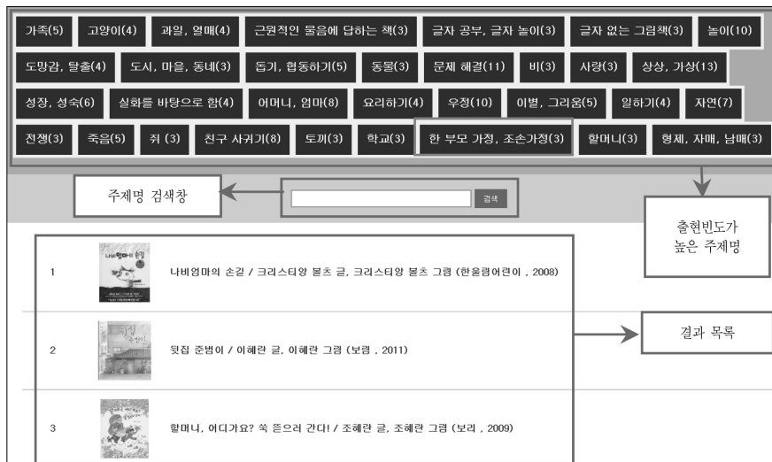
<그림 5> 주제명을 이용한 그림책 검색 화면

을 부여할 때의 가장 큰 장점은 자료에 대한 주제접근성이 향상되는 것이다. 자료의 검색은 자유 키워드를 통해서도 가능하지만, 제어 어휘를 이용한 주제 검색은 체계성과 일관성면에서 장점을 갖는다. <그림 5>는 각 그림책에 부여된 주제명을 이용한 검색화면이다. 화면 상단에는 5권 이상의 그림책에 출현한 주제명 32개를 제시하였다. '가족'이나 '고양이'와 같은 주제명을 클릭하면, 바로 해당 주제명이 부여된 그림책을 조회할 수 있다. 그리고 중간의 검색창은 출현 횟수와 관련 없이 해당 주제명을 가진 그림책을 키워드로 검색할 수 있다. 하단의 결과 화면은 '한 부모 가정, 조손가정'이라는 주제명을 가진 그림책을 제시한 것이다. 첫 번째 그림책인 『나비엄마의 손길』은 아빠와 아들이 꽃밭을 가꾸며 돌아가신 엄마를 생각하는 내용이다. 또한 다음 책인 『뒷집 준범이』는 할머니와 단둘이 사는 준범이에 관한 내용이며, 다음으로 『할머니, 어디가요? 속 뜯으러 간다!』 역시 할머니와